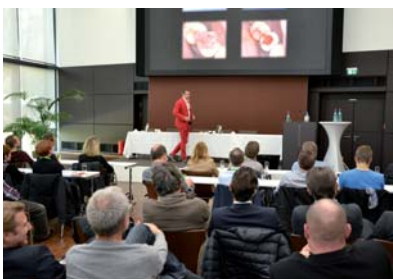
Abb. 3: Insgesamt war die Tagung sehr gut besucht – auch das „Expertenforum Endodontie“.