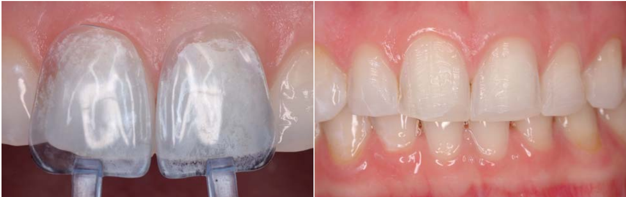
Abb. 5: Die passende Größe der Kompositveneers wird mit dem Contour Guide ausgewählt. Es ist darauf zu achten, dass das prospektive Veneer die Zähne vollständig bedeckt. Im Zweifelsfall sollte die größere Form gewählt werden, die anschließend in die passende Form getrimmt werden kann. – Abb. 6: Zustand nach minimalen Präparationsmaßnahmen im Bereich der vier Frontzähne. Zahn 23 wurde nicht präpariert.