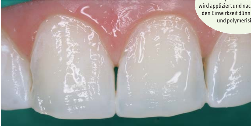
Abb. 12: Das Zwei-Schritt Etch & Rinse Adhäsivsystem One Coat Bond wird appliziert und nach 20 Sekunden Einwirkzeit dünn verblasen und polymerisiert.

transluzenteres Kompositmaterial (Farbe Enamel Universal) aufgebracht. Um Luftfeinschlüsse und störende Unterschüsse zu vermeiden, wurde das Komposit ebenfalls sparsam auf die Oberfläche der fünf Frontzähne appliziert. Anschließend wurden alle Schalen gleichzeitig mit dem mitgelieferten Applikationsinstrument unter sanftem, aber konstantem Druck in die entsprechende Position gebracht. Während die Schalen in Position gehalten werden, können grobe Überschüsse mit einem Handinstrument entfernt und das Komposit sicher an die Ränder adaptiert werden. Danach erfolgt die Lichtpolymerisation für jeweils mindestens 60 Sekunden. Die grobe Überschussentfernung wurde mit rotierenden Instrumenten durchgeführt. Für die Bearbeitung der approximalen Bereiche eignen sich Finier- und Polierstreifen unterschiedlicher Rauigkeiten. In einem abschließenden Arbeitsschritt wird das Ergebnis noch individuell mit unterschiedlichen rotierenden Instrumenten akzentuiert (Abb. 13 und 14). Vergleicht man den Ausgangszustand (Abb. 2 und 3) mit dem Endresultat (Abb. 13 und 14), so kann eine deutliche Verbesserung der Situation beobachtet werden.