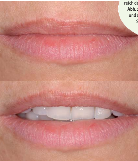
Abb. 1: Lippenbild der 29-jährigen Patientin. Die ästhetischen Beeinträchtigungen im Bereich der Frontzähne sind nicht zu erkennen. – Abb. 2: Beim Lächeln werden die erosions- und abrasionsartigen Defekte der oberen Schneidezähne deutlich sichtbar. Die Schneidekanten sind teilweise verkürzt.

Die ästhetischen Ansprüche und Bedürfnisse unserer Patientinnen und Patienten sind sicherlich in den letzten Jahren immer weiter gestiegen. Nicht zuletzt infolge des etablierten und weiter anwachsenden Mundgesundheitsbewusstseins sind ästhetische Korrekturen im sichtbaren Frontzahnbereich ein Wunsch, mit dem wir in der Praxis nahezu täglich konfrontiert werden. Die Möglichkeiten reichen dabei von Bleichtherapien bis hin zu direkten und indirekten Restaurationstechniken, wie beispielsweise Kompositrestaurationen oder Veneerversorgungen. Eine zusätzliche Versorgungsvariante, die in den letzten Jahren auf dem Markt eingeführt wurde, ist die Kombination von direkter Technik mit präfabrizierten, industriell hergestellten Veneers aus Komposit. In vorliegendem Beitrag wurde das Componeer-System benutzt.