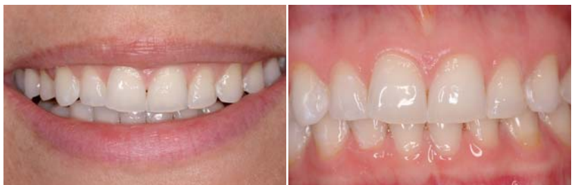
Abb. 3: Beim Lachen stören sich Patienten an ihren Oberkieferfrontzähnen. Die erosiven Veränderungen sind zu erkennen. – Abb. 4: Die frontale Ansicht gibt einen Überblick über das Ausmaß der Defekte.

indirekten Restaurationsmöglichkeiten mithilfe von Kronen oder Veneers aus Vollkeramik oder teilweise auch Komposit zur Verfügung. 3,4 Direkte Restaurationen in größerem Ausmaß sind bezüglich Zeit, Verarbeitungstechnik und Formgestaltung aufwendig und benötigen ein nicht zu unterschätzendes Maß an individuellen Fertigkeiten. Der große Vorteil liegt allerdings darin, dass die direkte Technik im Vergleich zu indirekten Verfahren weniger oder gar nicht invasiv und meist auch weniger kos-