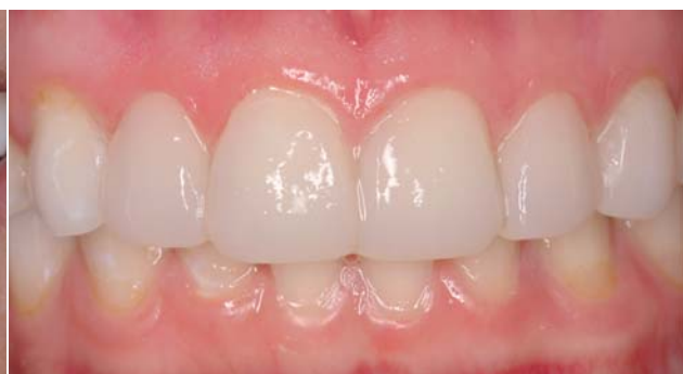
Abb. 13: Deutlich verbesserter Gesamteindruck der Patientin beim Lächeln. – Abb. 14: Die frontale Ansicht zeigt im Vergleich zum Ausgangsbefund ein gelungenes Ergebnis. Die Restaurationen wurden mit rotierenden Instrumenten, Polierscheiben und Polierbürstchen individualisiert und fertig ausgearbeitet.