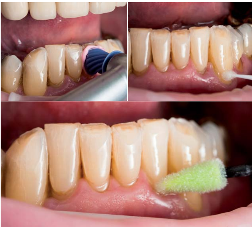
Abb. 5: Schonendes Reinigen bei exponierten Zahnhälsen mit der feinen Proxyl-Paste. – Abb. 6: Gezielte Applikation des chlorhexidinhaltigen Schutzlackes entlang des Gingivalsaumes. – Abb. 7: In der gleichen Sitzung: Applikation einer feinen Schicht Fluor Protector auf das angetrocknete Cervitec Plus.

Wurzelkariesläsionen. Darüber hinaus verbessert sich der Status vorhandener Defekte hinsichtlich ihrer Ausdehnung, Tiefe, Farbe und Textur. Das Fortschreiten des kariösen Prozesses lässt sich verlangsamen oder sogar ganz stoppen. Verfärbungen treten auch nach häufigerer Anwendung nicht auf. 7 Hoch ist der Wert der Anwendung eines chlorhexidinhaltigen Lacksystems für die Prävention von Sekundär- und Wurzelkaries an Pfeilerzähnen des herausnehmbaren Zahnersatzes einzuschätzen (Abb. 3). 8 Für die vierteljährliche Applikation eines Chlorhexidin-Thymol-Lackes zur Reduktion des Wurzelkariesaufkommens spricht sich das Expertengremium der „American Dental Association (ADA)“ aus. 9