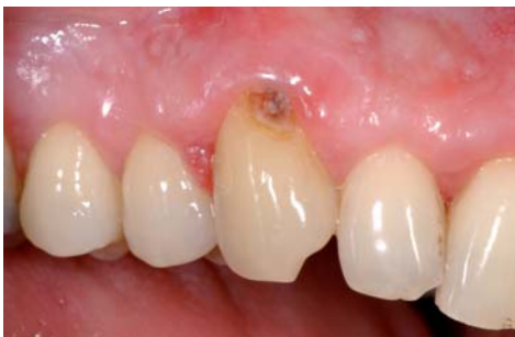
Abb. 1: Wurzelkaries.

Präventive und therapeutische Konzepte müssen sowohl die Ätiologie der Wurzelkaries als auch die Rahmenbedingungen bei älteren Menschen berücksichtigen. Ein zentraler Ansatz der Behandlungsstrategie besteht darin, das empfindliche Zahnhartgewebe schnell und einfach zu schützen, die bakterielle Aktivität auf den Wurzeloberflächen zu reduzieren und die Zahnhartsubstanz zu stärken. Die Kombination eines chlorhexidinhaltigen Schutzlackes mit einem Fluoridlack bietet diese Möglichkeit.