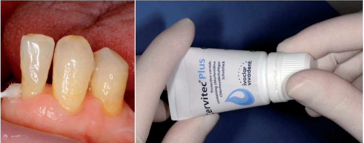
Abb. 3: Wichtig: die Prävention von Wurzelkaries an Pfeilerzähnen des herausnehmbaren Zahnersatzes. – Abb. 4: Schutzlack mit Chlorhexidin und Thymol.