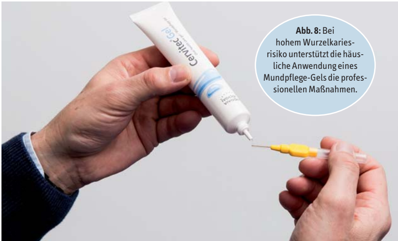
Abb. 8: Bei hohem Wurzelkariesrisiko unterstützt die häusliche Anwendung eines Mundpflege-Gels die professionellen Maßnahmen.