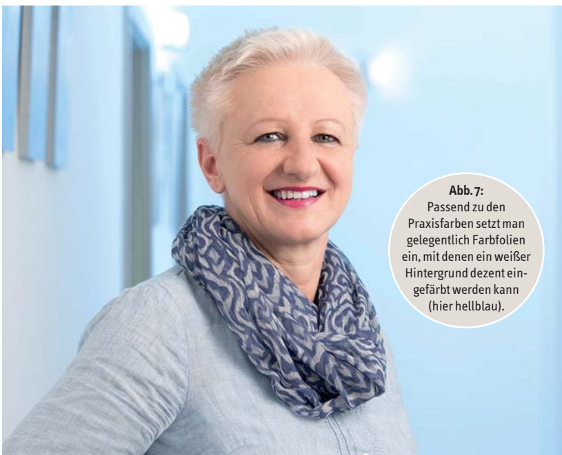
Abb. 7: Passend zu den Praxisfarben setzt man gelegentlich Farbfolien ein, mit denen ein weißer Hintergrund dezent eingefärbt werden kann (hier hellblau).

Natürlich sind wir Zahnärzte stolz auf unsere neue Behandlungseinheit, bei der die Turbine mit 400.000 Umdrehungen pro Minute dreht. Außerdem hat sie mehr gekostet als ein schicker Sportwagen. Der Patient sieht das aus einem anderen Blickwinkel. Welche Frau, die sich einen Frauenarzt sucht, achtet darauf, wie dessen „Untersuchungstuhl“ aussieht? Sie legt eher Wert darauf, dass der Behandler und sein Team nett und sympathisch wirken als auf die „Technik“. Daher sollte man