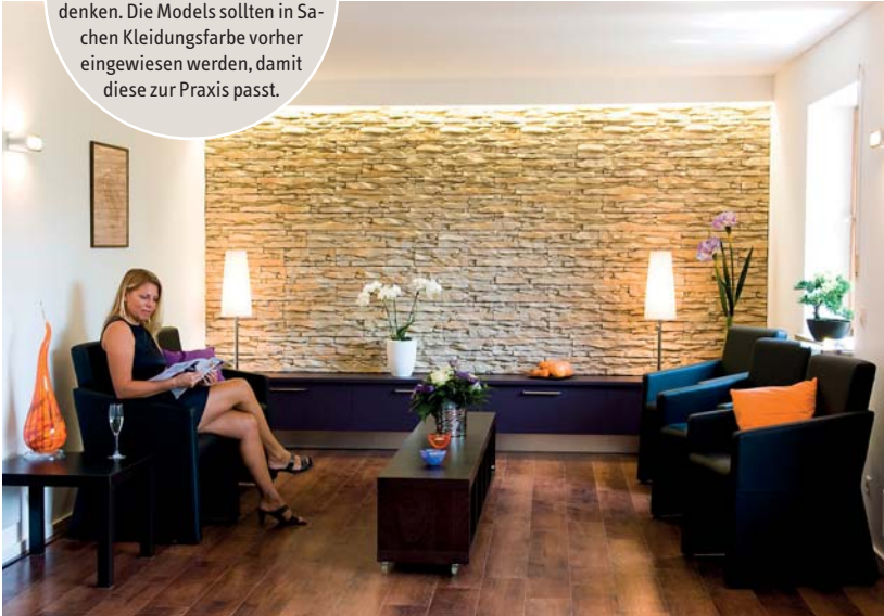
Abb. 10: Statt eines leeren Wartezimmers sollte man auch hier Menschen einbeziehen und ebenso an Dekoration denken. Die Models sollten in Sachen Kleidungsfarbe vorher eingewiesen werden, damit diese zur Praxis passt.

xiss shooting – je nach Anforderung mitunter auch ein ganzer. Die Sätze reichen meist zwischen 500,00 und 1.400,00 EUR netto für ein Praxisshooting plus Anfahrt und ggf. Spesen. Mit dem Fotograf sollte vorher besprochen werden, dass in den Kosten auch die Rechte für die Nutzung der Bilder enthalten sind und nicht noch obendrauf kommen.