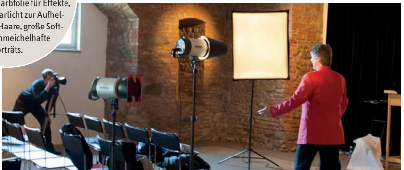
Abb. 2: Ein professioneller Fotograf setzt mehrere Studioblitze zur Beleuchtung ein. Hier (von links nach rechts): Hintergrundlicht mit Farbfolie für Effekte, Kopf- bzw. Haarlicht zur Aufhellung dunkler Haare, große Softbox für schmeichelhafte Porträts.

ruht auf dem griechischen phōs (Licht) und grāphein (Zeichnen, Malen) – oft findet man als Übersetzung „Malen mit Licht“. Wenn ich die Kunden daraufhin frage, ob sie über eine Licht- oder Blitzanlage verfügen, mit der sie die Praxis professionell ausleuchten können, sehe ich meist zwei Fragezeichen in den Augen. Oder der kamerainterne Blitz wird ausgeklappt – der reiche doch bestimmt auch. Ein Profifotograf schleppt normalerweise eine „mobile Studioblitzanlage“ in die Praxis und beleuchtet die zu fotografierenden Objekte mit „richtig viel Licht“. Hier trennt man in Hauptlicht, Hilfslicht, Kopf- oder Haarlicht und Hintergrundlicht. Bei uns sind das meist zwischen drei und fünf Studioblitze mit diversen Lichtformern (teilweise richtig große Licht-