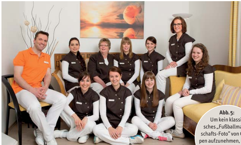
Abb. 5: Um kein klassisches „Fußballmannschafts-Foto“ von Gruppen aufzunehmen, bieten sich auch sitzende Arrangements an.