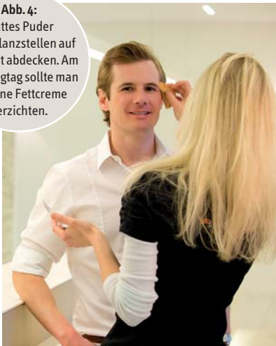
Abb. 4: Mattes Puder kann Glanzstellen auf der Haut abdecken. Am Shootingtag sollte man auf eine Fettcreme verzichten.

Wer viele Mitarbeiter hat, benötigt meist auch ein schönes Gruppenfoto. In der Regel müssen die Einzelpersonen dann vernünftig aufgestellt werden, damit alle gut zu sehen sind. Da nicht immer alle so unterschiedlich groß sind, wie es für das Bild nötig ist, kann man prima Einzelne auf Kopierpapierpakete stellen. Wird später nur ein „Oberkörperausschnitt“ verwendet, sieht man nicht mehr, wer erhöht auf den Papierstapeln positioniert wurde. Alternativ bieten sich Fotos im Sitzen an, um „zwei Ebenen“ zu schaffen (Abb. 5). Bei Teams wirken kleinere Gruppen meist harmonischer als die „Fußballmannschaft“. Möchte man den Chef „in den Vordergrund“ rücken,