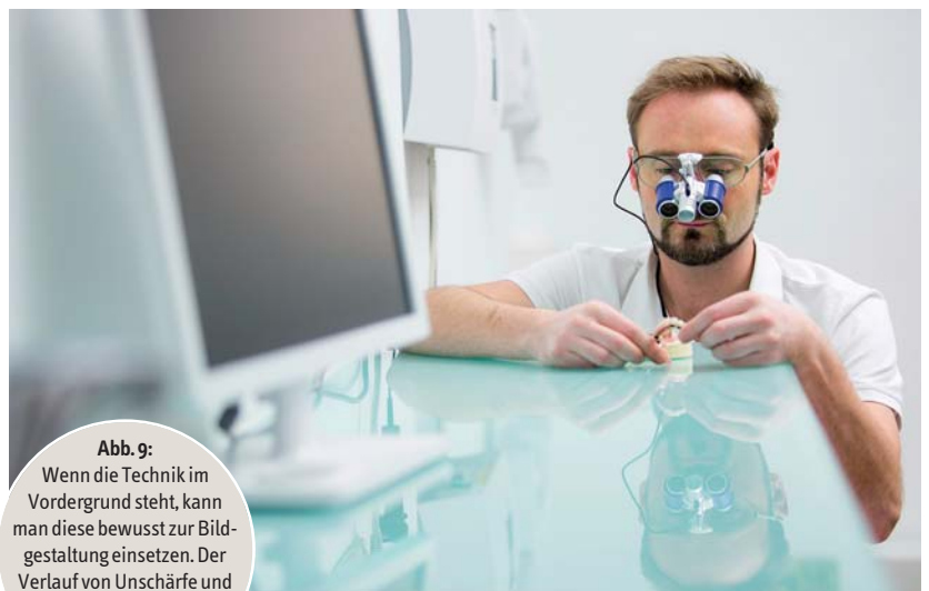
Abb. 9: Wenn die Technik im Vordergrund steht, kann man diese bewusst zur Bildgestaltung einsetzen. Der Verlauf von Unschärfe und Schärfe erzeugt Spannung im Bild.

Der Fotograf sollte branchenspezifisches Fachwissen mitbringen oder von einer Agentur entsprechend gesteuert werden. So kann eine Zahnarztpraxis passend in Szene gesetzt und auf wichtige Details zur professionellen Praxisdarstellung auf den Fotos geachtet werden.