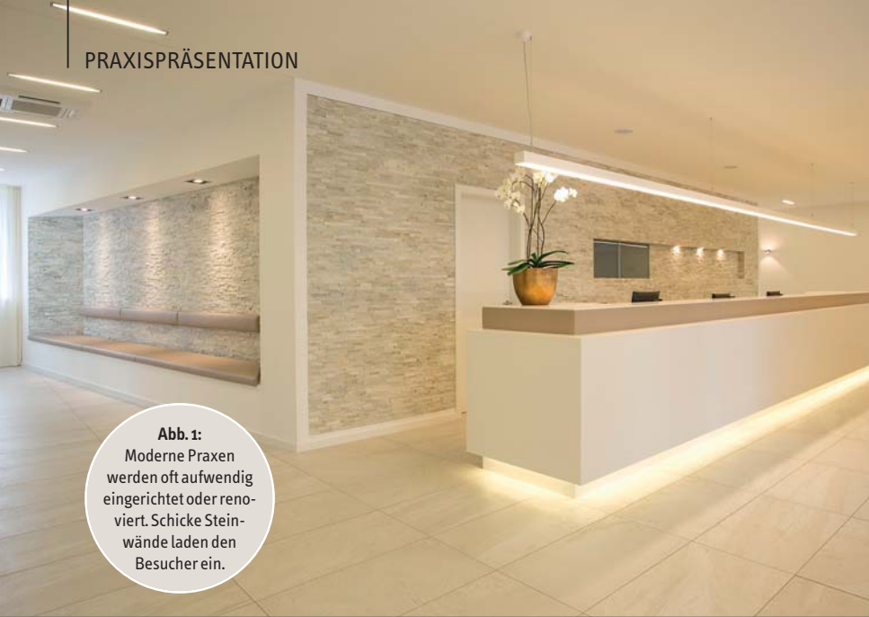
Abb. 1: Moderne Praxen werden oft aufwendig eingerichtet oder renoviert. Schicke Steinwände laden den Besucher ein.