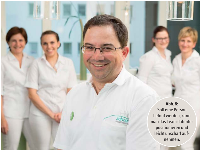
Abb. 6: Soll eine Person betont werden, kann man das Team dahinter positionieren und leicht unscharf aufnehmen.

bieten sich auch Aufnahmen mit Schärfverlauf an. Eine interessante Abwechslung zum Einzelporträt kann ein Bild sein, bei dem der Behandler vor seinem Team (leicht unscharf im Hintergrund) zu sehen ist (Abb. 6). Für Einzelporträts empfiehlt es sich, den Hintergrund zur Bildgestaltung mit einzubeziehen. Das wirkt spannender als eine Person vor einer weißen Wand. Bei Bedarf kann man weiße Wände mit farbigem Akzentlicht anstrahlen, um einen zur Corporate Identity der Praxis passenden Farblook zu erzeugen (Abb. 7).