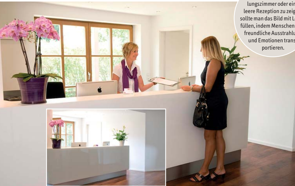
Abb. 8: Statt ein leeres Behandlungszimmer oder eine leere Rezeption zu zeigen, sollte man das Bild mit Leben füllen, indem Menschen eine freundliche Ausstrahlung und Emotionen transportieren.