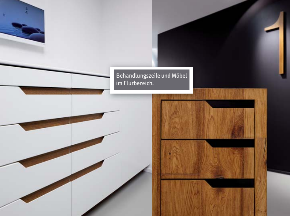
Behandlungszeile und Möbel im Flurbereich.