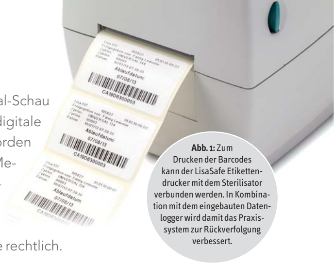
Abb. 1: Zum Drucken der Barcodes kann der LisaSafe Etikettendrucker mit dem Sterilisator verbunden werden. In Kombination mit dem eingebauten Datenlogger wird damit das Praxis-system zur Rückverfolgung verbessert.

Die erst kurz zurückliegende 36. Internationale Dental-Schau hat noch einmal mehr deutlich gemacht, wie wichtig digitale Verfahren heute für die moderne Zahnarztpraxis geworden sind. Besonders im Bereich der Praxishygiene und Medizinproduktaufbereitung erleichtern neue Technologien zunehmend die Arbeitsabläufe. Für Behandler, Praxisteam und Patienten entsteht daraus gleichermaßen ein Mehr an Sicherheit – gesundheitlich sowie rechtlich.