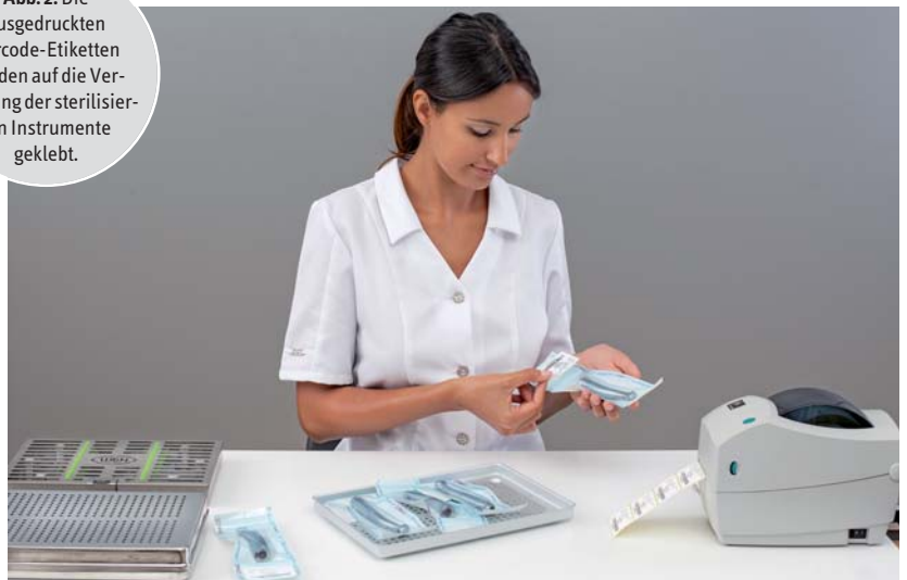
Abb. 2: Die ausgedruckten Barcode-Etiketten werden auf die Verpackung der sterilisierten Instrumente geklebt.

Hygienepläne bis hin zur vollautomatischen Dokumentation der Aufbereitungsprozesse. Und besonders bei Letzterem kann die moderne Technik dem Praxisbetreiber einen enormen Vorteil bieten. Während bei der Dokumentation in Papierform das Risiko unvollständiger oder fehlerhafter Aufbereitungsberichte relativ groß ist, garantiert eine digitale Dokumentation die lückenlose und nachvollziehbare Protokollierung aller Arbeitsschritte – mit weniger Arbeitsaufwand.