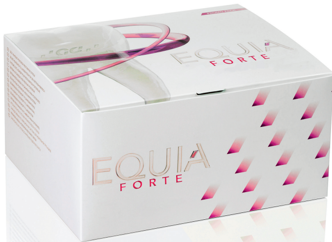
EQUIA Forte – Restaurationssystem mit Glashybrid-Technologie.

rialzusammensetzung: Bei der Glashybrid-Technologie des Restaurationssystems sind im Vergleich zu konventionellen GIZ zusätzliche deutlich kleinere Füllkörper (Silikate) integriert – sie sollen zu einer größeren Kreuzvernetzung in der Matrix führen. Das Zementpulver enthält außerdem eine im Vergleich zu früheren Entwicklungsstufen reaktivere Polyacrylsäure, die ebenfalls eine bessere Vernetzung und