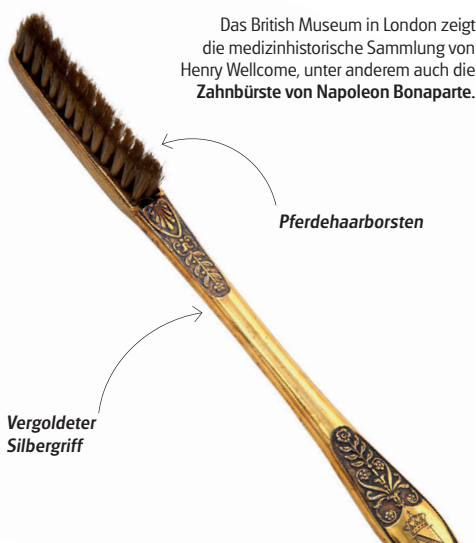
Das British Museum in London zeigt die medizinhistorische Sammlung von Henry Wellcome, unter anderem auch die Zahnbürste von Napoleon Bonaparte .