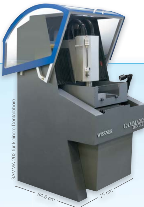
GAMMA 202 für kleinere Dentallabore