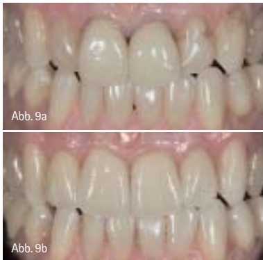
Abb. 9a: Alte Metallkeramikronen (Zähne 11 und 21) und verfärbte (Zahn 12) bzw. mit unästhetischen Kompositfüllungen versorgte Zähne (Zahn 22) beeinträchtigen deutlich das Lachen des Patienten. – Abb. 9b: Umgestaltung der Oberkieferschneidezähne durch ein Veneer (Zahn 22) und drei Zirkonoxidkronen (Zähne 12–21). Funktion und Ästhetik sind wiederhergestellt (Zahntechnik: Hubert Schenk).

können. Auf ein tiefes Separieren der Brückenglieder muss aus Stabilitätsgründen ebenfalls verzichtet werden. Speziell das Separieren mit einer Diamanttrennscheibe kann Spannungsrissschäden auslösen, welche die Langzeitfestigkeit der Keramik stark reduzieren. Generell sollten die Konnektoren abgerundete Formen haben und keine scharfen Kanten aufweisen, an denen sich ansonsten bei Belastungen Spannungsspitzen konzentrieren. Bereits bei der Patientenauswahl muss darauf geachtet werden, dass die Verbinderstärken im Brückengerüst eingehalten werden können, speziell eine minimale Konnektorhöhe von 3 mm (Abb. 7). Gleichzeitig muss begutachtet werden, ob die fertige Restauration bei den gegebenen Ausmaßen immer noch eine korrekte Parodontalhygiene erlaubt. Probleme ergeben sich v.a. bei sehr kurzen klinischen Kronen der Pfeilerzähne oder stark elongierten Antagonisten.