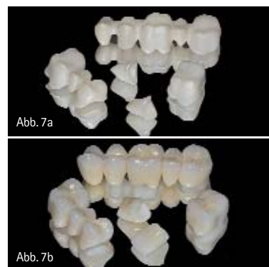
Abb. 7a: Unverblendete Zirkonoxidgerüste mit ausreichend dimensionierten Kappchenstärken und Konnektoren. – Abb. 7b: Zustand nach Verblendung der Gerüste (Zahntechnik: Hubert Schenk).

bereich, Freiendbrücken mit max. einem Anhänger, Inlay-/Onlaybrücken, Marylandbrücken und Implantat-Abutments. Einzelne Hersteller von CAD/CAM-Systemen geben mittlerweile auch bis zu zehngliedrige Brücken frei. Mittlerweile werden auch in der Doppelkronenversorgungstechnik in vielen Fällen Primärteile aus Zirkonoxid für Teleskopkronen mit dünnen Wandstärken angefertigt. Auch industriell vorgefertigte, konfektionierte Wurzelstifte aus Zirkonoxid werden angeboten (z.B. Cosmopost; Ivoclar Vivadent). Reine Aluminiumoxidkeramik (Procera AllCeram; Nobel Biocare) wird für Einzelkronen, Abutments und dreigliedrige Brücken eingesetzt. Keramiken mit hohem Oxidgehalt verfügen zwar über hohe Festigkeiten, sind aber andererseits opaker und weniger lichtdurchlässig als Silikatkeramiken, so dass diese Werkstoffe nur als Kernmaterialien eingesetzt und mit einer Silikat-Aufbrennkeramik verblendet werden, welche für die gewünschte Ästhetik sorgt. Die Kronenkappen und Brückengerüste aus Oxidkeramik bieten jedoch im Vergleich zu metallgestützten Verblendkronen den Vorteil, dass bereits das