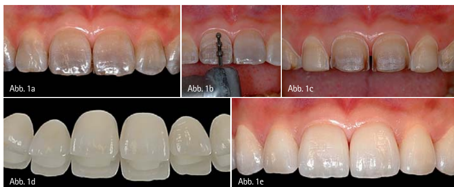
Abb. 1a: Starke Verfärbungen durch Tetracyclineinlagerungen. – Abb. 1b: Vorbereitung der Veneerpräparation durch Anlegen von Tiefenmarkierungen. – Abb. 1c: Fertige Veneerpräparationen. – Abb. 1d: Labortechnisch fertiggestellte Keramikveneers (Zahn-technik: Hubert Schenk). – Abb. 1e: Perfekte Korrektur der Zahnfarbe mit vollkeramischen Veneers.

... inklusive Befestigungsmodus (konventionell vs. adhäsiv) unterteilen. Die Festigkeitseigenschaften der unterschiedlichen Keramikarten bestimmen sowohl ihren klinischen Indikationsbereich als auch die Art der Befestigung.