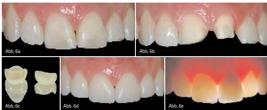
Abb. 6a: Patientin mit ästhetisch insuffizienter großer Kompositfüllung an Zahn 11 und adhäsiv wiederbefestigtem Zahnfragment nach Trauma am endodontisch behandelten Zahn 21. – Abb. 6b: Präparationen für ein Keramikveneer am rechten und eine Zirkonoxidkrone am linken mittleren Schneidezahn. – Abb. 6c: Labortechnisch fertiggestelltes Veneer und Zirkonoxidkrone (Zahn-technik: Hubert Schenk). – Abb. 6d: Die Arbeiten aus Vollkeramik stellen Funktion und Ästhetik in eindrucksvoller Weise wieder her. – Abb. 6e: Im Durchlicht zeigt sich die natürlich wirkende Lichtleitung der vollkeramischen Restaurationen.