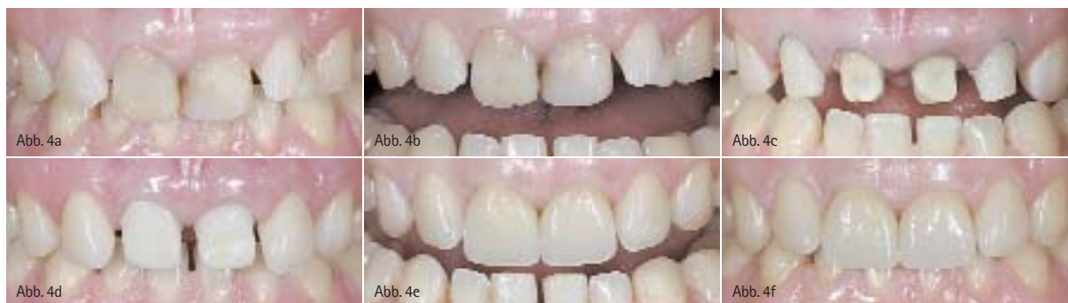
Abb. 4a: Patient mit unästhetischer, lückiger OK-Front und deutlicher Tendenz zum Tiefdeckbiss an den mittleren Inzisivi. – Abb. 4b: Bei leichter Öffnung zeigen sich auch die deutlich abradieren Eckzahnspitzen. – Abb. 4c: Präparation für Keramikveneers an den lateralen und Zirkonoxidkronen an den mittleren Schneidezähnen. – Abb. 4d: Nach adhäsiver Befestigung der Veneers werden die noch nicht ausgedünnten Zirkonoxidkäppchen für die nachfolgende „Pick-up“-Abformung einprobiert. – Abb. 4e: Die verblendeten Zirkonoxidkronen bilden mit den individuell geschichteten Veneers eine harmonische Einheit. Sämtliche Eckzähne wurden mit plastischen Kompositrestaurationen wieder aufgebaut. – Abb. 4f: Endsituation in habitueller Interkuspitation. Funktion und Ästhetik sind wiederhergestellt (Zahntechnik: Hubert Schenk).

geführt. Dabei kommt es durch die zuvor berücksichtigte Sinterschrumpfung des im vorgesinterten Zustand gefrästen Gerüsts zur dreidimensionalen Volumenreduktion und Einstellung der Passung. Bei der Sinterung können eventuell durch die vorhergehende Fräsbearbeitung eingebrachte Mikrorisse wieder verschlossen werden. Zur Fertigstellung werden die (eingefärbten) Zirkonoxidgerüste mit silikatkeramischen Massen verblendet. Hierdurch wird die dreidimensionale anatomische Gestaltung der Restaurationen vervollständigt und die exzellente Ästhetik etabliert.