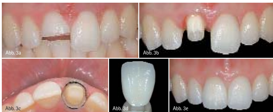
Abb. 3a: Patientin mit Fraktur des rechten mittleren OK-Schneidezahns auf halber Zahnhöhe. – Abb. 3b: Präparation für eine Glaskeramikkrone. – Abb. 3c: Die inzisale Ansicht zeigt den zirkulär nötigen Substanzabtrag von 1 mm im Bereich der Stufe. – Abb. 3d: Labortechnisch fertiggestellte Glaskeramikkrone (hochfestes glaskeramisches Käppchen mit individuell geschichteter Verblendung) (Zahntechnik: Hubert Schenk). – Abb. 3e: Funktion und Ästhetik sind durch die adhäsiv geklebte Glaskeramikkrone wieder hergestellt.

Unter standardisierten und kontrollierten industriellen Bedingungen produzierte Keramikrohlinge weisen weniger Gefügefehler auf als im zahntechnischen Labor hergestellte Einlagefüllungen bzw. Kronen- und Brückengerüste. Sie verfügen entsprechend über konstante und bessere Materialeigenschaften. Die Zahnform wird hier über ein maschinell-subtraktives Bearbeitungsverfahren herausgearbeitet. Diese Art der zerspanenden Verarbeitung erlaubt auch den Einsatz von keramischen Werkstoffen, die mit den begrenzten Möglichkeiten des konventionellen zahntechnischen Labors nicht zu verarbeiten sind. Systeme, die industriell produzierte Feldspat- oder Glaskeramikrohlinge bearbeiten, sind z.B. Celay (Kopierfräsverfahren; Mikrona Technology), CEREC (CAD/CAM; Sirona) oder Everest (CAD/CAM; KaVo).