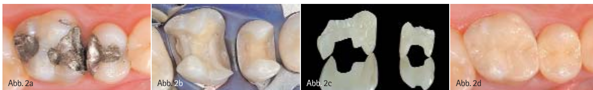
Abb. 2a: Alte insuffiziente Amalgamfüllungen im Oberkieferseitenzahnbereich. – Abb. 2b: Präparationen für ein Keramikinlay im zweiten Prämolaren und eine Keramikteilkrone im ersten Molaren. – Abb. 2c: Labortechnisch fertiggestellte Keramikeinlagefüllungen (Zahntechnik: Dentallabor Gibisch, Mering). – Abb. 2d: Funktion und Ästhetik sind durch die adhäsiv geklebten Keramikeinlagefüllungen wieder hergestellt.

blendkeramiken unter Anwendung der Sintertechnik verblendet (Schichttechnik) werden. Durch den Pressvorgang entfällt die Sinterschrumpfung, die dimensionsgetreue Herstellung der Restaurationen wird erleichtert; eine gesteigerte Homogenität des Werkstücks resultiert in höheren Festigkeiten. Die Biegefestigkeit der Presskeramiken liegt im Bereich von etwa 120 MPa für den Grundwerkstoff und knapp 200 MPa für den oberflächenveredelten Werkstoff. Der Indikationsbereich umfasst Veneers, Inlays, Onlays, Teilkronen (Abb. 2) und im Einzelfall auch Einzelkronen. Keramiken mit einer Biegefestigkeit unter 350 MPa sind für eine konventionelle Zementierung nicht geeignet und müssen deshalb unter Anwendung eines Dentinhaftvermittlers und Befestigungskomposits adhäsiv eingesetzt werden. Mit dem dadurch erzielten kraftschlüssigen Verbund zwischen Restauration und Zahnhartsubstanz resultiert eine deutliche Erhöhung der Belastbarkeit, da die Restorationsinnenseite keine mechanische Grenzfläche mehr darstellt, an der rissauslösende Zugspannungen wirksam werden können.