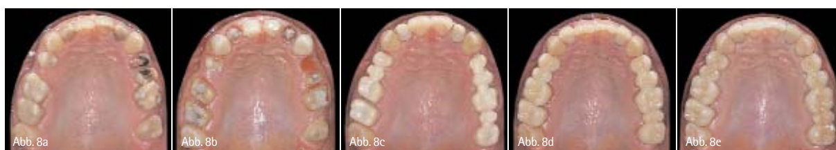
Abb. 8a: Patient mit prothetischem Sanierungsbedarf im Oberkiefer. – Abb. 8b: Präparationen für Keramikveneers an den mittleren Schneidezähnen und multiplen Kronen- und Brückenrestorationen im restlichen Bereich. – Abb. 8c: Nach adhäsiver Befestigung der Veneers erfolgt die Einprobe der Zirkonoxidgerüste. Mit den Gerüsten als Träger wird nochmals eine Kieferrelationsbestimmung vorgenommen. – Abb. 8d: Im Rohbrandstatus wird zuerst die grundsätzliche Funktion und Ästhetik kontrolliert, anschließend wird die statische und dynamische Okklusion perfekt eingeschliffen. – Abb. 8e: Die definitiv befestigten Zirkonoxidkeramikrestaurationen stellen Funktion und Ästhetik in eindrucksvoller Weise wieder her (Zahntechnik: Hubert Schenk).

unterschritten werden. Im Frontzahnbereich kann der Verbinderquerschnitt von dreigliedrigen Zirkonoxidbrücken bei einigen Herstellern sogar auf bis zu 7 mm 2 reduziert werden. Ein elliptischer Verbinder kann zwar ausreichend dimensioniert sein, bei gleichem Querschnittsareal ist die Ausrichtung in Hochkant-Richtung jener der Querlage mechanisch überlegen, da sich in der Deformationsberechnung die Höhe in dritter Potenz auswirkt, während die Breite nur linear in die Berechnungsformel eingeht. Die Oberflächenqualität der Keramik beeinflusst ihre Biegefestigkeit. Eine korrekte Ausarbeitung und Nachbearbeitung des Brückengerüsts sind deshalb von großer Bedeutung. Oberflächendefekte können die Festigkeit des Brückengerüsts oder nachfolgend der verblendeten einzugliedernden Arbeit herabsetzen. Speziell die kritische Unterseite (Zugseite) der Konnektoren bei Brücken darf auf keinen Fall bearbeitet werden, da ansonsten Oberflächendefekte, wie Mikrorisse oder thermische Spannungen, durch den Schleifvorgang verursacht werden können, deren negative Auswirkungen nicht kontrolliert werden