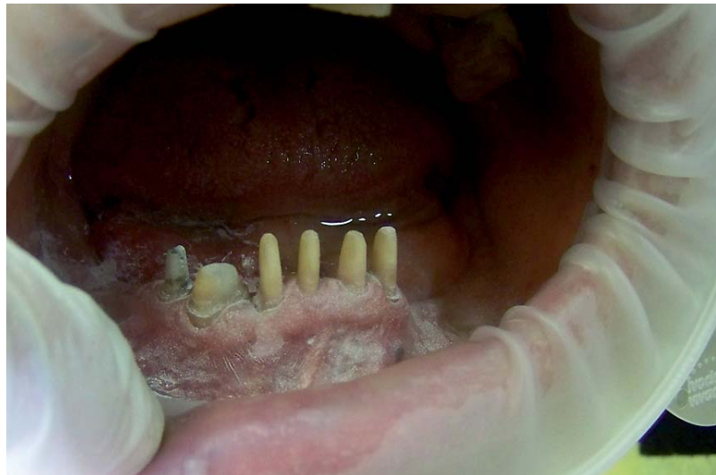
Abb. 1: Nach vorsichtiger Trocknung wurden die Zähne leicht mit Scanpuder beschichtet.

Nach Erläuterung der Behandlungsalternativen entschied sich der Patient für einen Teleskopzahnersatz unter Ein-