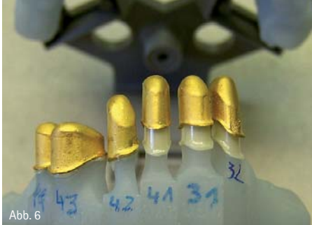
Abb. 2: Frontzähne von Ober- und Unterkiefer werden gescannt und der C.O.S. zeigt das Ergebnis in Sekundenschnelle am Monitor. – Abb. 3: Dem Zahntechniker stehen eine 2-D- und eine 3-D-Ansicht zur Verfügung. – Abb. 4: Nach circa drei Arbeitstagen kommen die Modelle und die Primärkronen wieder in das Labor und werden vom Zahntechniker weiter bearbeitet. – Abb. 5: Die ausgearbeiteten Primärteile wurden im Mund einprobiert. – Abb. 6: Auf den keramischen Primärkronen wurden im Labor Galvano-Sekundärteile angefertigt.

Trocknung leicht mit Scanpuder beschichtet (Abb. 1).