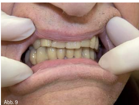
Abb. 7-9: Fertige Arbeit – der Patient war mit dem Ergebnis sehr zufrieden.