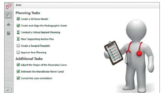
Abb. 3: Ein Helfer überwacht die gesamte Planung.