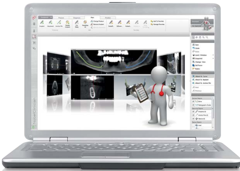
Abb. 1: Laptop mit NobelClinician Software.

nun die 3-D-Diagnose, 3-D-Planung und die schablonengeführte Insertion der Implantate zur Unterstützung eines vorhersagbaren, positiven Behandlungsergebnisses. NobelGuide ermög-