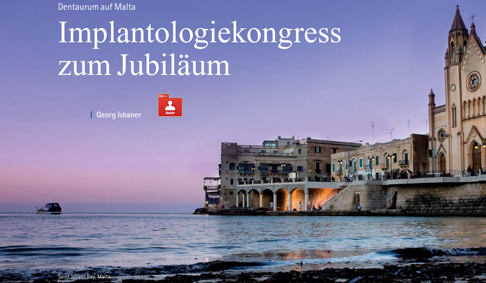
Saint Julian's Bay, Malta.

Anlässlich des 125-jährigen Bestehens von Dentaurum fand vom 22. bis 25. September ein Implantologiekongress auf Malta statt. Mehr als 350 internationale Teilnehmer nahmen an wissenschaftlichen Vorträgen, praktischen Workshops und einem außergewöhnlichen Rahmenprogramm teil.