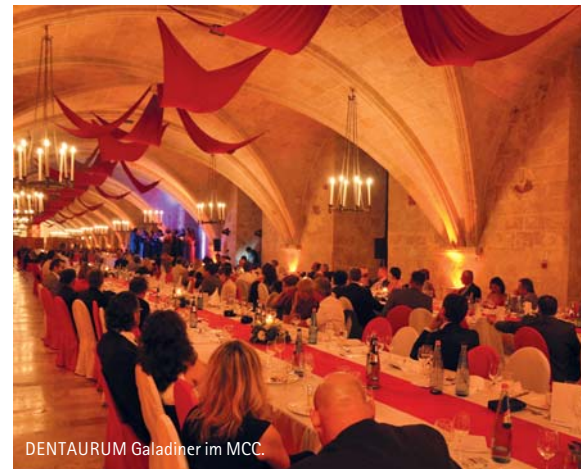
DENTAURUM Galadiner im MCC.