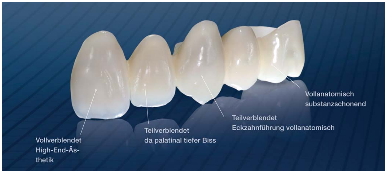
Vielseitige Anwendung von transluzentem Zirkonoxid.

vollanatomisch, teilverblendet, vollverblendet – und das bei Bedarf sogar in Mischform innerhalb einer einzigen Restauration. Dieser Variantenreichtum macht Zirkonoxid der neuen Generation zu einem multiindikativen Werkstoff – ein spannendes Arbeitsfeld für unser Laborteam.