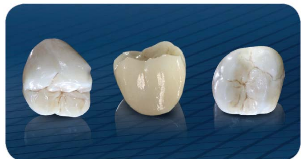
Links: Transluzentes Zirkonoxid im Frontzahnbereich in Verbindung mit der Schichttechnik. – Rechts: Substanzschonend vollanatomisch in Verbindung mit der Maltechnik im Seitenzahnbereich.