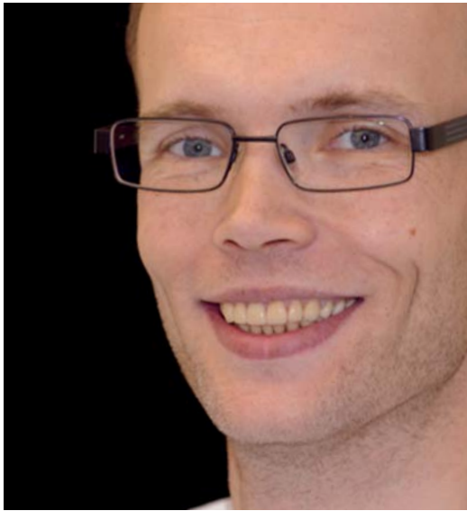
Abb. 19: Trotz schwieriger Ausgangslage ein ästhetisch ansprechendes Ergebnis mit einem zufriedenen Patienten.

eine tiefe Fossa-Präparation (van Iperen 2005)). Diese Vorgaben wurden auch im vorgestellten Fall umgesetzt (Abb. 10 und 14). Insgesamt orientieren sich die Empfehlungen für die Cercon-Präparation an den für Vollkeramiksyste- me bekannten Präparationsrichtlinien (Langschwager 2003, Rudolph und Quass 2009). Bei vollkeramischen Kronen ist für die Ästhetik und den langfristigen Erfolg der Kronen der Platzbedarf bei der Präparation entscheidend. Eine wesentliche Rolle für die Bruchfestigkeit spielt unter anderem eine ausreichende okklusale Materialstärke (Hajtó 2010). Die Mindestwandstärken für Cercon ht werden vom Hersteller okklusal mit 0,5 mm inklusive 0,1 mm Einschleifreserve, zirkulär mindestens 0,4 mm und in den Randbereichen mit 0,2 mm angegeben. Mit der stetigen Weiterentwicklung der Vollkeramik (Vollmann et al. 2009) eignen sich heute auch teil- und vollanatomisch gefertigte Kronen für schwierige Ausgangssituationen; mit einer in Schicht- und/oder Maltechnik erzielten optimalen Zahnfarbe. Klinische Studien, wie die zu Extensions-