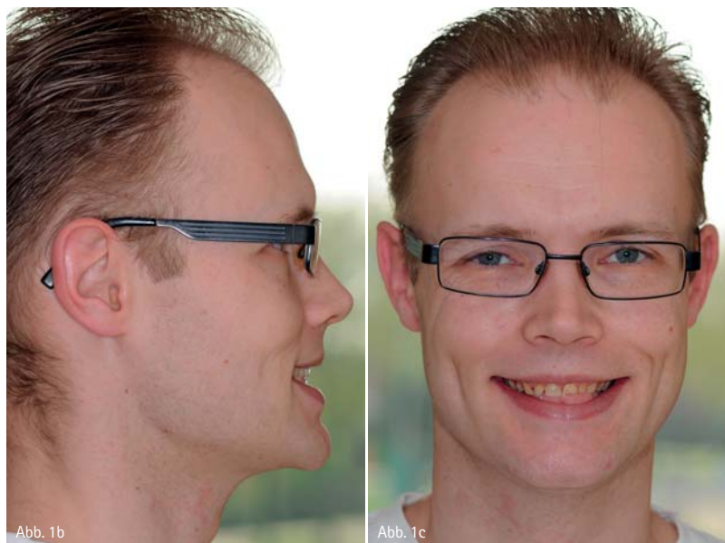
Abb. 1b und c: Ausgangssituation. Insuffiziente Füllungen, Zahnhartsubstanzdefekte – der Patient ist mit dem äußeren Erscheinungsbild nicht zufrieden.

D er Werkstoff Zirkonoxid ist eine hochfeste und zähe Keramik, mit der sich umfassende metallfreie Restaurationen durchführen lassen (Beuer 2008, von Blanckenburg und Wüstefeld 2004). Immer wieder wird darauf hingewiesen, dass Gerüste aus Hochleistungskeramik eine ausreichend hohe Transluzenz besitzen, die einen harmonischen Übergang von der Restauration zum Zahn bewirkt (Langschwager 2003, Schärer 2002). Dank seiner natürlichen Ästhetik ist dieser Werkstoff deshalb heute aus der Zahnheilkunde nicht mehr wegzudenken. Neben den ästhetischen Möglichkeiten sprechen aber auch