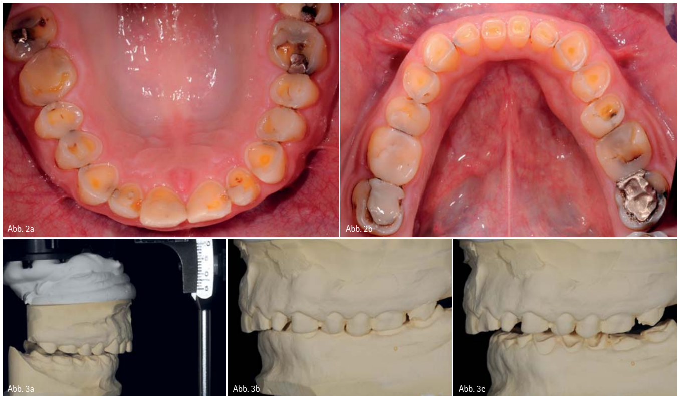
Abb. 2a: Situation vor der Behandlung (Oberkieferansicht). – Abb. 2b: Situation vor der Behandlung (Unterkieferansicht). – Abb. 3a bis c: Modellansichten, inklusive Interkuspidationsposition.

luzenz, und dies unter Bewahrung der über mehr als zehn Jahre in zahlreichen In-vitro- und In-vivo-Studien belegten Sicherheit.