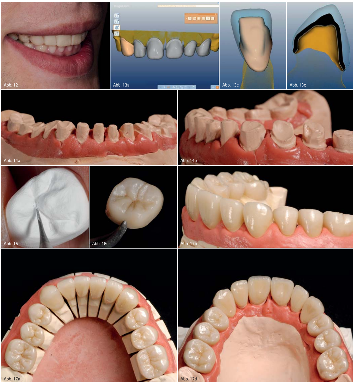
Abb. 12: Die Provisorien sind eingegliedert. – Abb. 13a und b: Die aus den Parametern ermittelte Gerüstgeometrie ist auf dem Stumpf dargestellt. – Abb. 13c und d: Computergestützte Konstruktion eines Frontzahnes in der Frontal- und Lateralansicht. – Abb. 13e: Schnittdarstellung des Gerüsts. – Abb. 14a und b: Modellsituation. – Abb. 15: Ein Rohling wird beschliffen ... – Abb. 16a bis c: ... und bemalt. – Abb. 17a bis d: Fertige Restaurationen auf den Modellen.

grenze wurde werkstoffgerecht mit einer breiten Hohlkehle gestaltet, die Kanten wurden abgerundet. Die Platzverhältnisse wurden mit einem Vorwall aus Silikon kontrolliert (Abb. 11). Nach der Abformung und der Eingliederung der Provisorien (Abb. 12) wurden die Restaurationen im Labor gefertigt. Es wurden vollanatomische Kronen, auch im Frontzahnbereich, aus den voreingefärbten Rohlingen Cercon ht light und medium hergestellt. Diese wurden mit den Malfarben Cercon ht body-base und body-match individuell