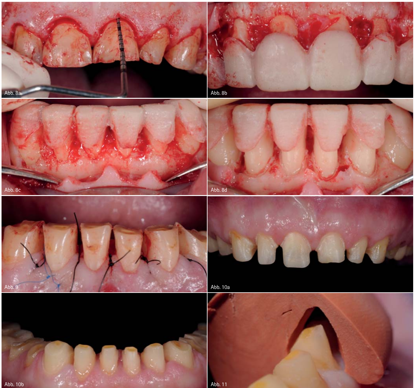
Abb. 8a bis d: Chirurgische Kronenverlängerung in der OK- bzw. UK-Front. – Abb. 9: Atraumatische Naht. – Abb. 10a bis d: Präparation der Zähne. – Abb. 11: Die Platzverhältnisse werden mit einem Vorwall aus Silikon kontrolliert.

tion nochmals bestätigten (Abb. 3). Die Modellanalyse im Denar-Artikulator erfolgte nach Bestimmung einer Cardiax-Kiefergelenkvermessung sowie Gesichtsbogenbestimmung, Fotodokumentation und Wax-up. Die besondere Problematik des Falls sind die schlechten vertikalen Verhältnisse (Abb. 4a und b). Es zeigte sich dabei, dass eine Kronenverlängerung in der Ober- und Unterkieferfront erforderlich war (Abb. 5 und 6). Dazu wurde ein Wax-up der Zähne unter Korrektur des Zahnsaumverlaufes auf dem Gips-