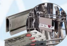
Wash-Checks Reinigungsindikatoren für RDG

Weitere Informationen zu unseren Produkten und Hygiene-Workshops finden Sie unter www.stericop.com