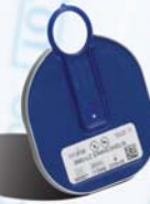
SMU-LC 121°C/134°C Einweg-Helixstest (DIN EN 867-5)