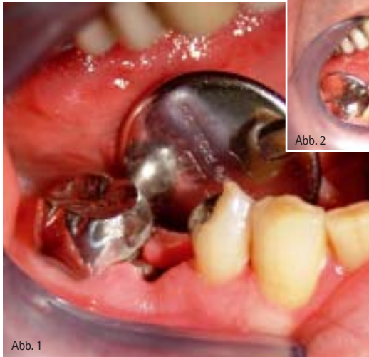
Abb. 1: Extraktionsalveole Zahn 45 nach missglückter Endodontiebehandlung alio loco. Der Patient hatte sehr starke Schmerzen. Diese projizierte er auf den (unschuldigen) Zahn 46 und war nur schwer davon abzubringen, diesen sofort extrahieren zu lassen. – Abb. 2: Bereits eine nur einmalige Einlage mit Socketol beruhigte die Extraktionsalveole mit dem Dolor post. – Abb. 3: Und von einer Extraktion des 46 war plötzlich auch keine Rede mehr.