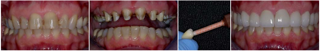
Abb. 1: Gesamtansicht eines Patienten vor der Behandlung. – Abb. 2: Präparationen. – Abb. 3: Einbringen von Maxcem™ Elite in Lava-Krone. – Abb. 4: Postoperative Gesamtansicht der zementierten Restaurationen.