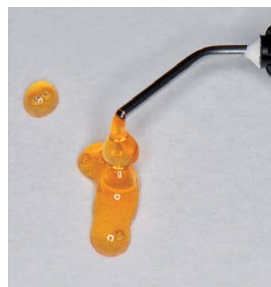
Abb. 2: Das Thermogel ist bei Raumtemperatur noch relativ flüssig, zeigt aber bereits seine Standfestigkeit. Die Viskosität nimmt bei Kontakt mit Oralgewebe un-mittelbar zu.

trolliert platziert werden. Praktisch ist auch die leuchtend orangene Farbe von Racegel, dank derer das Material im Gegensatz zu beispielsweise klaren Präparaten sehr gut sichtbar ist und daher eine kontrolliertere Dosierung und Positionierung ermöglicht.