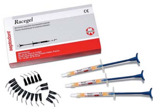
Abb. 1: Racegel von Septodont dient der Gingivaretraktion zur Aufweitung des Sulkus und Blutstillung.