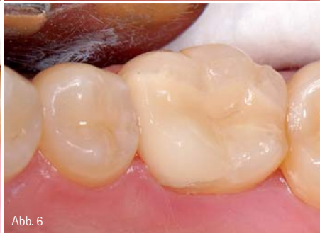
Abb. 3: Auch im Seitenzahnbereich und an schwer zugänglichen Stellen ... – Abb. 4: ... kann das Gel dank vorgebogener Applikationsspitze leicht appliziert werden. – Abb. 5: Nach zweiminütiger Einwirkzeit wird das Gel einfach mit Wasser abgespült. – Abb. 6: Dank der schonenden Gingivaretraktion zeigt sich eine reizlose Schleimhautsituation.

Sulkus ohne jegliche Druckausübung und das passive Abhalten der Gingiva gewährleistet. Vor allem bei fragiler Gingiva empfiehlt sich dieses Vorgehen, da das epitheliale Attachment durch eine Übertraumatisierung leicht zerstört werden kann und dies wiederum kann zu Rezessionen führen. Erfordert die klinische Situation hingegen