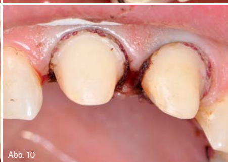
Abb. 7: Präparation im Frontzahnbereich. – Abb. 8: Das Gel läuft nicht weg und tropft nicht. – Abb. 9: Erfordert es die klinische Situation, kann in den bereits eröffneten Sulkus ... – Abb. 10: ... nun besonders komfortabel ein Retraktionsfaden gelegt werden.