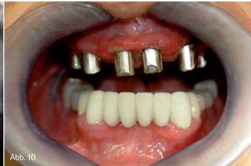
Abb. 7: Genau drei Tropfen der so gefilterten Lösung aus der Spritze werden nun auf die runde Öffnung der Testkassette aufgetropft, ohne die Spritze auf diese Öffnung aufzusetzen. – Abb. 8: Nach fünf Minuten ist das Ergebnis klar zu sehen: In diesem Fall wurde die PA-Erkrankung erfolgreich gestoppt. – Abb. 9: Behandlungsfall 1: Patientin, 86 Jahre, Situation nach schweren Allgemeinerkrankungen (siehe Text), röntgenologisch ohne Befund. – Abb. 10: Klinisches Erscheinungsbild: Mukositis.

von fünf Minuten bis zum Ablesen des Testergebnisses wieder verschwindet.