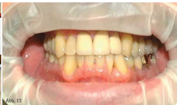
Abb. 11: Das Ergebnis des PerioMarker® Schnelltests zeigt dringenden Handlungsbedarf. – Abb. 12: Die Prothese wird die Patientin in der nächsten Zeit vor dem Einsetzen mit Chlorhexamed®-Direkt Gel beschicken. – Abb. 13: Behandlungsfall 2: Situation nach einer systematischen PA-Behandlung vor zehn Jahren als Folge einer NUG.