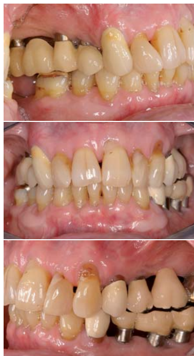
Abb. 1 bis 3: 77-jähriger männlicher Patient nach 23 Jahren im regelmäßigen Recall.

Um Erkrankungen wie Gingivitis und Parodontitis, aber auch Karies zu vermeiden bzw. ein Fortschreiten zu verhindern, gewinnt die präventiv orientierte zahnmedizinische Betreuung von Patienten in den letzten Jahren zunehmend an Bedeutung; dies gilt für alle Altersgruppen gleichermaßen. Neben einer frühzeitigen Diagnostik von Karies, Gingivitis und Parodontitis und Einleitung entsprechender therapeu-