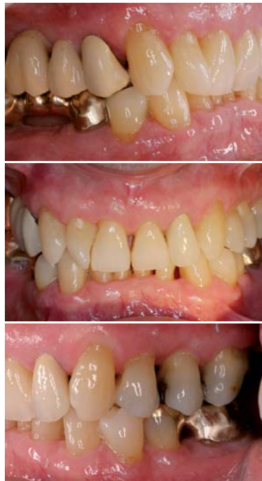
Abb. 4 bis 6: 82-jähriger männlicher Patient nach 27 Jahren im regelmäßigen Recall.

Die einfachste Form der Biofilmentfernung ist eine intensive und effiziente häusliche Mundhygiene; ihr Nutzen ist in der Parodontologie hinlänglich belegt. Daraus ergibt sich, dass eine optimale häusliche Mundhygiene für die Nachhaltigkeit des Therapieerfolgs in allen Altersgruppen unumgänglich ist. Bei manifesten Parodontopathien ist jedoch die alleinige Optimierung der individuellen Mundhygiene nicht ausreichend. Im Rahmen einer systematischen Behandlungsabfolge werden zunächst die Mundhygiene des Patienten optimiert, Reizfaktoren beseitigt und pathogene Biofilme professionell entfernt (Hygienephase); es schließen sich das subgingivale Debridement (geschlossen) sowie gegebenenfalls korrektive Maßnahmen an und mündet schließlich in die (bedarfsorientiert) regelmäßig durchzuführende unterstützende Parodontitistherapie (UPT), mit dem Ziel, das erreichte Behandlungsergebnis langfristig aufrechtzuerhalten.