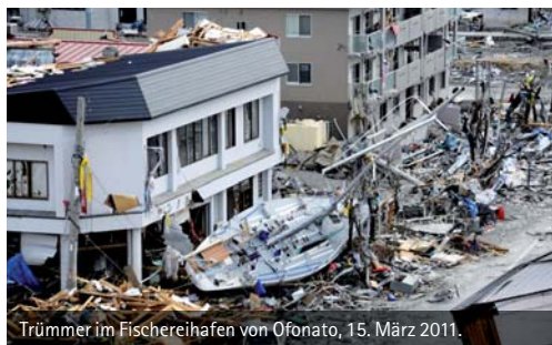
Trümmer im Fischereihafen von Ofonato, 15. März 2011.

Mitte März 2011 hat sich durch ein Seebeben vor der Küste Japans eine der bisher schlimmsten Tsunami-Katastrophen der Geschichte ereignet. Viele Tausend Menschen wurden getötet