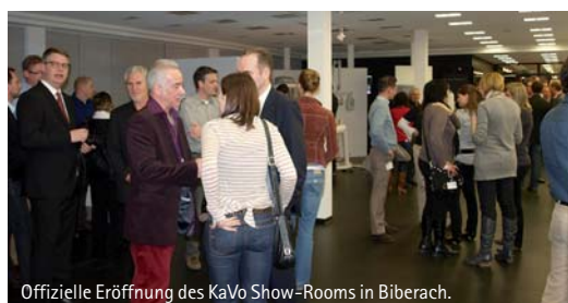
Offizielle Eröffnung des KaVo Show-Rooms in Biberach.

Rechtzeitig vor der IDS hat KaVo kräftig in die Modernisierung der repräsentativen Räumlichkeiten in Biberach investiert. Der Show-Room im fünften Stock