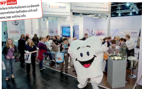
Der Stand von dentaltrade war ein wahrer Publikumsmagnet.

ZWP online Weitere Informationen zu diesem Unternehmen befinden sich auf www.zwp-online.info