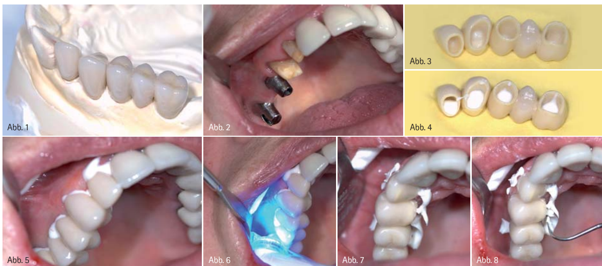
Abb. 1: Kronen auf Meistermodell. – Abb. 2: Vorbereitete Abutments und Zähne. – Abb. 3: Vorbereitete Kronen. – Abb. 4: Applizierter SA-Zement. – Abb. 5: Eingebrauchte Kronen. – Abb. 6: Kurze Lichthärtung. – Abb. 7: Gelockerte Überschüsse. – Abb. 8: Entfernen der Überschüsse. – Abb. 9: Eingegliederte Kronen vestibulär. – Abb. 10: Eingegliederte Kronen palatinal.

Auf dem Sektor der Befestigungszemente hat in den letzten Jahren eine starke Entwicklung stattgefunden. Eine Vielzahl von Produkten beschäftigt uns behandelnde Zahnärzte regelmäßig aufs Neue, sodass es in der Tat schwerfällt, den Überblick zu behalten. Im folgenden Beitrag werden die Vorteile eines selbstadhäsiven, dualhärtenden Befestigungskomposits der Firma Kuraray dargestellt.