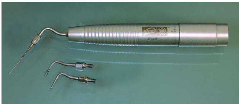
Abb. 5: Auch eine erfolgreiche endodontische Behandlung ist mit SonicLine möglich.

tungsstufe am Aircaler SF1LM ermöglicht eine für den Patienten schonende supra- und subgingivale Zahnstein- und Belagentfernung. Der Prophylaxe Scaler SF1 (Abb. 2) ermöglicht einen universellen Einsatz auch zum Entfernen von großflächigem Zahnstein. Durch die Gestaltung der Paro-Spitze SF4 (Abb. 3) – grazil wie eine PA-Sonde – ist die minimalinvasive Anwendung in der PA-Therapie unter Schonung des kollagenen Weichgewebes und der Wurzeloberfläche bis zu 9 mm Tiefe möglich. Ein verbessertes Bakterienmanagement trägt zum Behandlungserfolg bei. Der Polymer-Pin (Set 4611 enthält 10 Pins und 1 Halter) ist die ideale Ergänzung für das Prophylaxe-Konzept für den Implantatpatienten (Abb. 4). Die für den Einmalgebrauch bestimmten Polymer-Pins entfernen abrasionsfrei subgingival Konkremete und Beläge an Implantathälsen und hinterlassen eine glatte Oberfläche. Dies verhindert effektiv die Neubildung von Plaque.