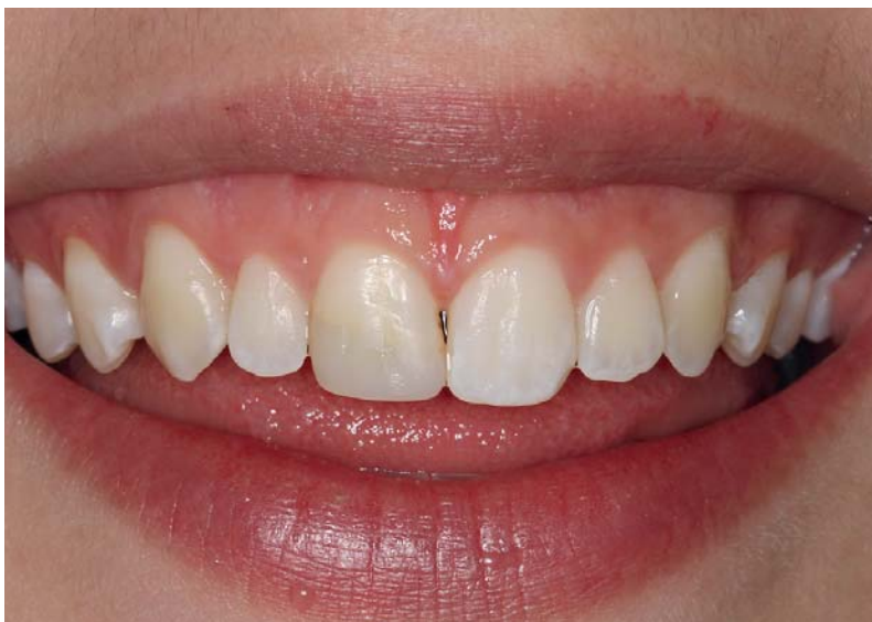
Abb. 1: Die Ausgangssituation zeigt einen unschönen Composite-Aufbau auf Zahn 11.

Der natürliche Zahn als Vorbild für eine ästhetische Restauration stellt sowohl hohe Anforderungen an den Behandler als auch an das Material. Moderne Werkstoffe sowie am natürlichen Zahn angelehnte Schichttechniken schaffen optimale Voraussetzungen für vorhersagbare ästhetische Resultate. Der vorliegende Fallbericht fokussiert die Restauration eines frakturierten Frontzahns und demonstriert die biomimetischen Eigenschaften von IPS Empress® Direct.