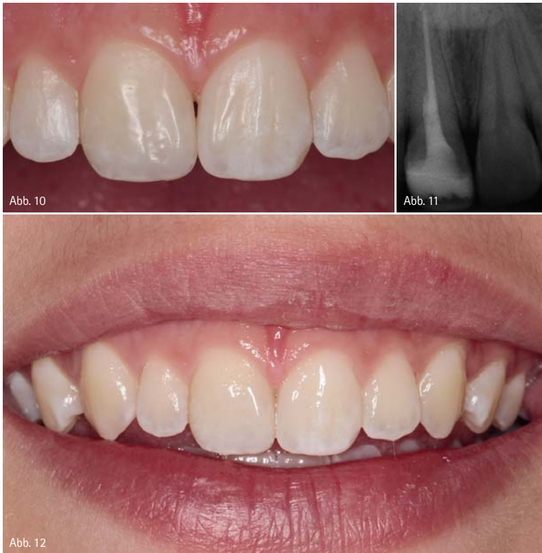
Abb. 10: Vier Wochen später ergibt die Nachkontrolle eine unauffällige klinische Situation. – Abb. 11: Das abschließende Röntgenbild mit Wurzelkanalfüllung und Composite-Restauration. – Abb. 12: Das Lippenbild einer zufriedenen Patientin.

Wand. Nach Entfernung von Matrizen und Keilen gibt eine dünne Composite-Schale die inzisalen, palatinalen und approximalen Konturen des Zahns in idealer Weise wieder (Abb. 5).