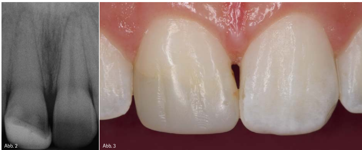
Abb. 2: Das Röntgenbild mit apikaler Parodontitis 11. – Abb. 3: Detailaufnahme der Zähne 11 und 21.

dem Aufbau erfassbar und überschaubar zu machen, ist eine landkartenähnliche Charakterisierung des Zahns sinnvoll. Hier werden unter anderem die Bereiche mit erhöhter Transluzenz oder Opazität erfasst. In diesem Zusammenhang kann ein Foto der Ausgangssituation und dessen Betrachtung auf dem Display der Digitalkamera bei der späteren Schichtung hilfreich sein. Zu beachten ist jedoch, dass das digitale Foto nur Hinweise auf die Platzierung der verschiedenen Composite-Massen und eventuell Malfarben gibt. Die rich-