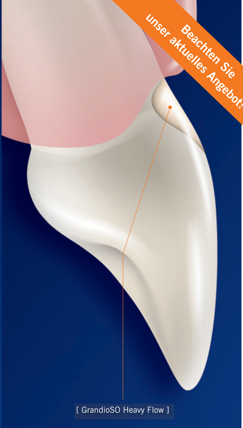
[ GrandioSO Heavy Flow ]