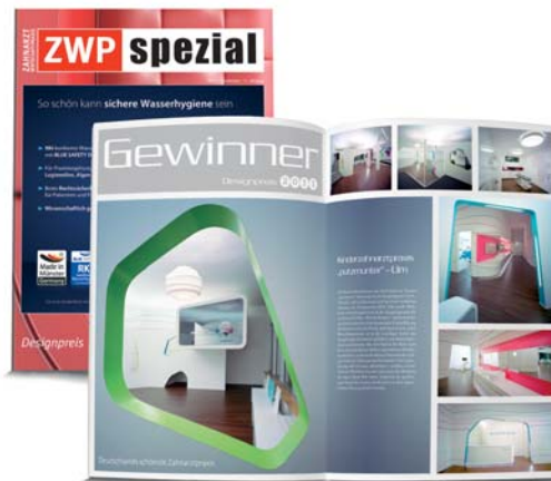
Bilderstrecke zum ZWP Designpreis-Gewinner 2011 in der ZWP spezial 9/2011.

weiligen Behandlungszimmer zu finden. Verlaufen können sich die Kinder in der weiträumigen Zahnarztpraxis also nicht. Und ebenso wenig kommen sie an der richtigen Zahnpflege vorbei – erster Zwischenstopp der Weltreise sind die in unterschiedlichen Höhen angeordneten Kinderwaschbecken zum Erlernen der richtigen Zahnpflege. „Mundhygiene ist immerhin der Kern der Praxis“, erklärt Katrin Lehmann.