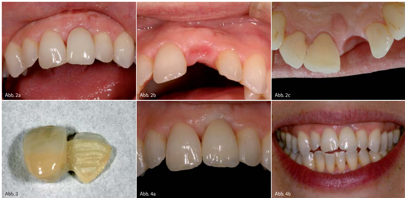
Abb. 2a: Provisorium zur Ausformung des Ponticdesigns. – Abb. 2b: Ausgeformtes Pontic. – Abb. 2c: Nach Präparation 11 und Pontic von palatinal. – Abb. 3: Einflügelige Marylandbrücke silikatisiert (Zirkon) und silanisiert (angepresste Glaskeramik Inzisalkante). – Abb. 4a: Weißliche Verfärbung der Gingiva während der Eingliederung. – Abb. 4b: Definitive Restauration direkt nach Eingliederung.

schimmerte. Es erfolgte eine Abformung für eine provisorische Versorgung, da die rote Ästhetik durch einen chirurgischen Eingriff unterhalb des Brückengliedes optimiert werden sollte.