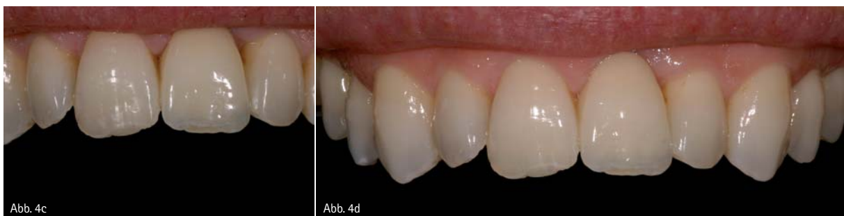
Abb. 4c: Harmonisches Gesamtergebnis. – Abb. 4d: Restauration nach sechs Monaten.

Das Zirkongerüst wurde mit Glaskeramik so überpresst, dass inzisal nur Glaskeramik vorhanden war und die Trans-