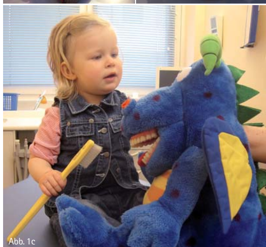
Abb. 1a–c: Kleinkinder sind leicht zu motivieren: Nach anfänglicher Skepsis kann man mithilfe einer Handpuppe mit Gebiss und großer Zahnbürste Kontakt zum Kind aufbauen.

Sie geduldig, aber bestimmt, seien Sie in unangenehmen Situationen ehrlich, aber arbeiten Sie mit kind- und altersgerechten positiven Formulierungen. Sie gewinnen das Vertrauen des Kindes, indem Sie seine Ängste und Sorgen nicht ignorieren und herunterspielen. Nehmen Sie das Kind ernst und sprechen Sie es direkt darauf an. „Ich merke doch, dass du dich nicht wohlfühlst (Hand des Kindes in die Hand nehmen, ggf. Hand sachte an den Kopf legen. Beim Sprechen den Mundschutz herunter ziehen, in die Augen schauen), warum hast du Angst?“