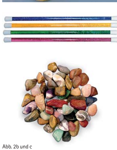
Abb. 2b und c