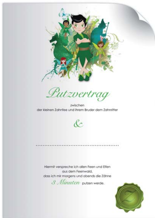
Ein Putzvertrag soll die Kinder zum Zähneputzen motivieren.

Kein Versprechen veranlasste Pauline auch nur im Ansatz zu kooperieren.