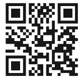
Mercy Ships Film

Auch Sie können nun 2013 vor Ort ehrenamtlich helfen. Sie investieren mindestens zwei Wochen Ihrer Zeit und Dürr Dental übernimmt die anfallenden Transfer- und Verpflegungskosten für freiwillige Zahnärzte, -ärztinnen und Assistentinnen.