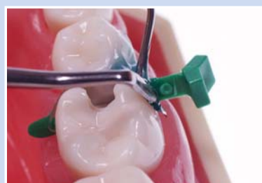
Spritzen Sie FenderMate Fix in den Zwischenraum zwischen dem Keil und der Matrize.