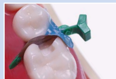
Aushärten mit UV Licht, anschließend fahren Sie mit der Restauration fort.