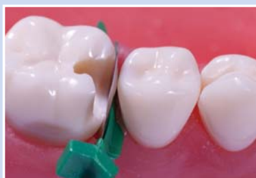
Grosse Kavität nach der Präparation. Platzierung wie üblich.

Die ideale Matrize für große Kavitäten, wenn sie mit dem neuen Matrizenfixierungs-Material von FenderMate verwendet wird. Ausgezeichnete Ergebnisse mit minimaler Nacharbeit.