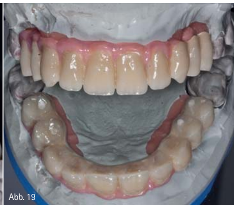
Abb. 18 und 19: Die auf dem PEEK-Material basierende fertige Restauration auf dem Modell.