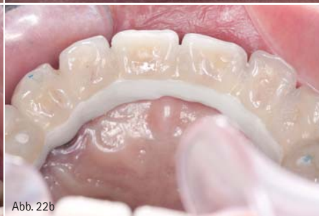
Abb. 20: Kontrolle drei Monate nach dem Einsetzen: Der Patient kommt mit seiner Versorgung bestens zurecht und ist zufrieden. Das Weichgewebe schmiegt sich an die Abutments (SKY elegance Abutment), die Teleskopprothese (BioHPP) sitzt fest und lässt sich einfach ein- und ausgliedern. – Abb. 21 und 22a+b: Auch die Ansicht von okklusal bestätigt die gute Weichgewebssituation. Eine Kontrolle der funktionellen Parameter bestätigte, dass der erste okklusale Kontaktpunkt auf dem PEEK-Gerüst ist und somit eine schnelle Abrasion (starker Bruxismus) der Verblendschalen umgangen wird.

die Langzeitstabilität und Mundgesundheit war. Die mit BioHPP überpressten Titanbasen wurden nach dem Ausbetten ausgearbeitet und auf dem Modell beziehungsweise im Fräsgerät auf 0 Grad geglättet und poliert.