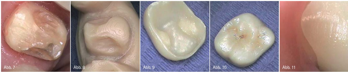
Abb. 7: Präparation von Zahn 16. – Abb. 8: Kunststoffmodell Zahn 16. – Abb. 9 und 10: Die im Fertigungszentrum gefräste Vollzirkonkrone für Zahn 16. – Abb. 11: Die Vollzirkonkrone für Zahn 16 passt perfekt.

Luxaform-Schiene. Diese wurde nach der Präparation mit provisorischem Kronen- und Brückenmaterial (Luxa-temp, DMG) aufgefüllt. So konnten wir ohne Modelle eine gut sitzende provisorische Versorgung schaffen.