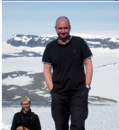
Großes Bild: Wunderbarer Überblick vom Bergrücken über die sonnengeflutete Bucht. – Es kann durchaus warm sein. Gut, dass ich nicht nur warme Sachen mitgenommen habe – gefühlte 20 Grad Celsius.