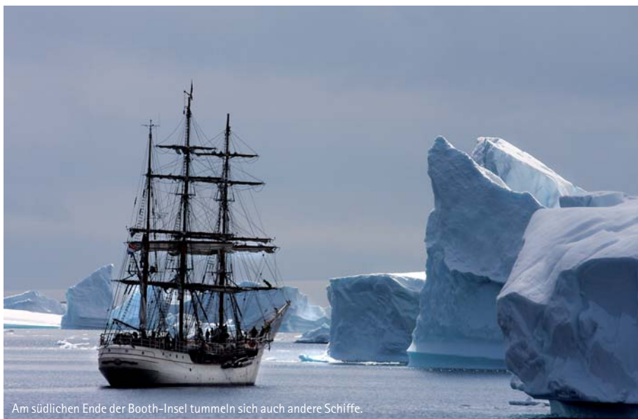
Am südlichen Ende der Booth-Insel tummeln sich auch andere Schiffe.

Anstieg zu einem Horn des Teufels (daher Devil Island) führte zunächst über ausgedehnte Schneefelder und Geröll. Ein sensationeller Ausblick entschädigte für den schweißtreibenden Aufstieg. Am Nachmittag setzte der Kapitän Kurs nach Süden. Nicht weit vor unserem Ziel, der Insel Snow Hill, war eine Weiterfahrt nicht mehr möglich. Das Meer war komplett zugefroren. Noch ein kurzer Ausflug zu den Eisber-