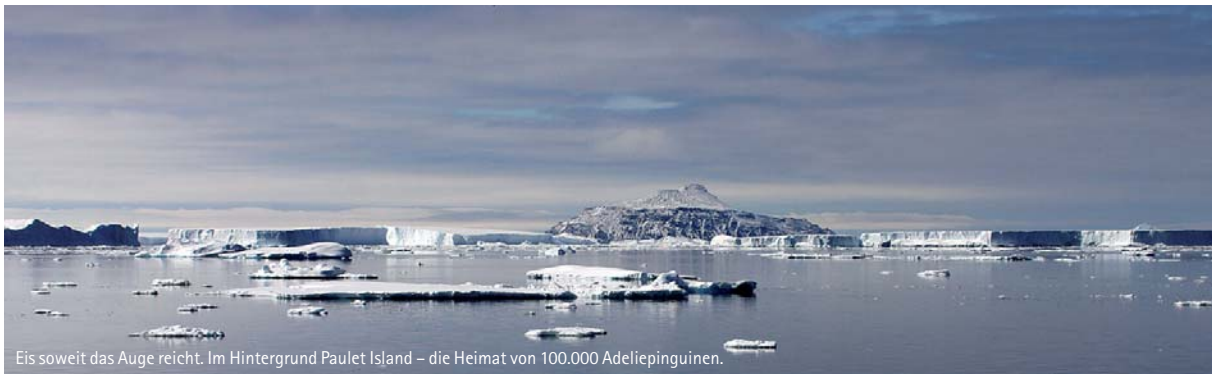
Eis soweit das Auge reicht. Im Hintergrund Paulet Island – die Heimat von 100.000 Adelpinguinen.