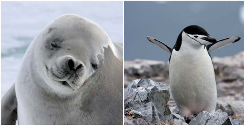
Links: Eine Krabbenfresserrobbe ruht sich auf einer Eisscholle aus. – Ähnlichkeiten mit britischen Polizisten sind schwer zu leugnen.