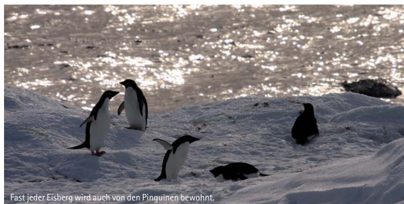
Fast jeder Eisberg wird auch von den Pinguinen bewohnt.

Je näher wir der antarktischen Halbinsel kamen, desto häufiger konnten wir Tafelberg am Horizont beobachten. Am Abend des 27. Dezember passierten wir endlich die der antarktischen Halbinsel vorgelagerten Inseln d'Urville und Joinville. Auch wenn Land endlich wieder zum Greifen nah war, würden wir noch den ganzen Abend und durch die Nacht fahren, um unser Ziel an der antarktischen Halbinsel zu erreichen. Wir hatten am 28. Dezember