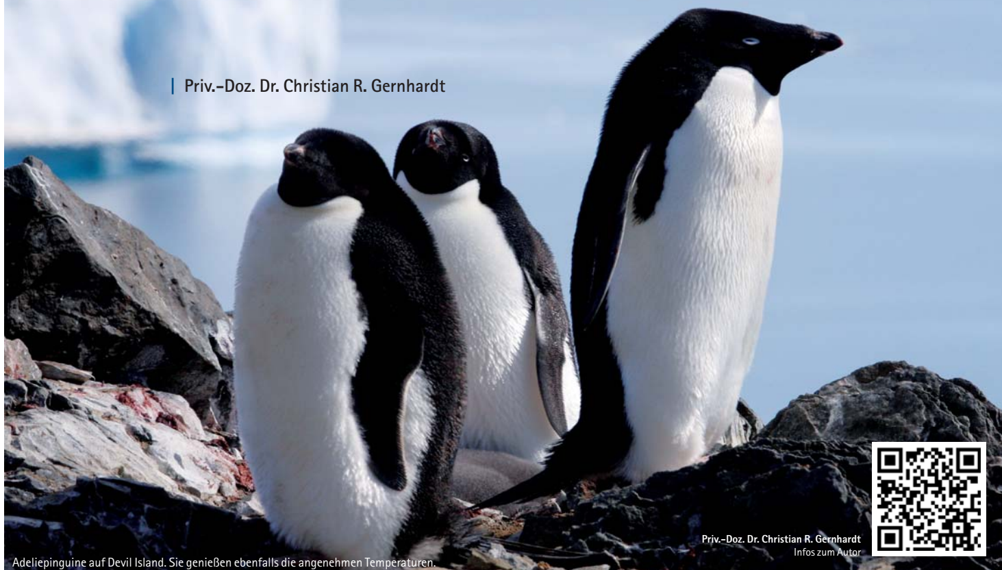
Adeliepinguine auf Devil Island. Sie genießen ebenfalls die angenehmen Temperaturen.