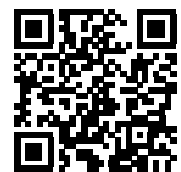
Sander Concept Infos zum Unternehmen