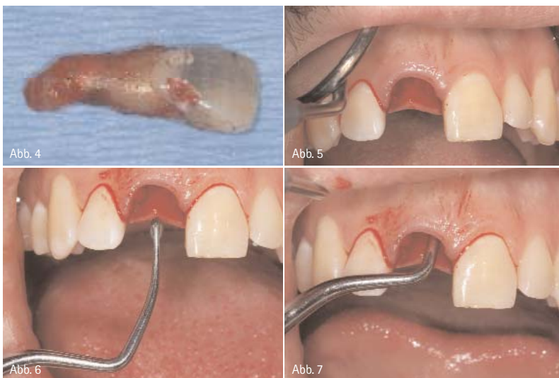
Abb. 4: Zahn 11 nach Exzision. – Abb. 5: Gut erhaltene marginale Gingiva nach Exzision. – Abb. 6 und 7: Bis weit nach nasal reichender Knochendefekt; durch Einbringen eines scharfen Löffels verdeutlicht.

Der in unserer Praxis im Frontzahnbereich in den allermeisten Fällen beschrittene Weg ist der der verzögerten Sofortimplantation. Hierbei wird die Extraktionsalveole mit Kollagenkegeln versorgt.