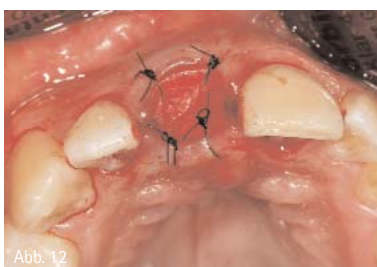
Abb. 12: Socket Repair Membran in situ mit Nähten fixiert.

Auch dieser Weg wurde hier nicht gewählt, da aufgrund des ausgedehnten Knochendefizits eine Primärstabilität des Implantats nicht sicher angenommen werden konnte.