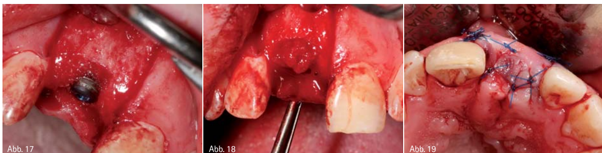
Abb.17: Implantat Regio 11 in situ mit zervikal freiliegenden Gewindegängen. – Abb.18: Freiliegende Gewindegänge mit autologem Knochen abgedeckt. – Abb.19: Zustand der Implantationsstelle nach Nahtversorgung.