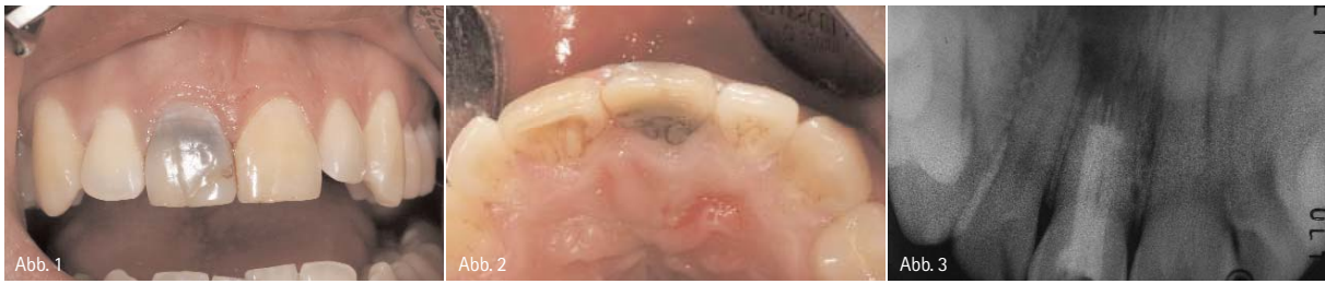
Abb.1: Ausgangssituation mit deutlich verfärbtem Zahn 11. – Abb. 2: Ansicht 11 von inzisal. – Abb. 3: ZF von 11; Zustand nach WF und WSR; radikuläre Zyste bis in den Apikalbereich 12 und weit nach nasal ausgedehnt.

ches Biotyp-Switching erleichtert das weitere Vorgehen oftmals und vereinfacht das Erreichen ästhetisch ansprechender Ergebnisse.