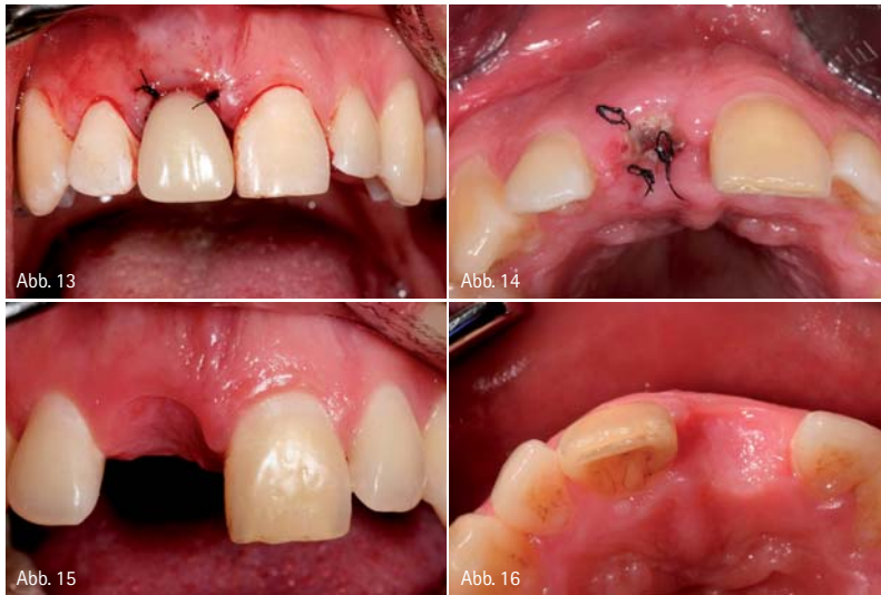
Abb.13: Interimsersatz 11 in situ. – Abb.14: Zustand nach einwöchiger Abheilung. – Abb.15: Situation 13 Wochen nach Extraktion; Ansicht von vestibulär. – Abb.16: Situation 13 Wochen nach Extraktion; Ansicht von inzisal.

Die Wundheilung verlief problemlos und schon bei Nahtentfernung nach sieben Tagen war die Membran nahezu vollständig zugranuliert (Abb. 14). Etwa drei Monate später stellte sich der Patient zur Implantation bei uns vor. Durch das schonende Vorgehen bei der Extraktion und den Erhalt des Knochens an den Nachbarzähnen war die Gingiva weiterhin gut abgestützt und die Interdentalpapillen konnten erhalten werden (Abb.15). Trotz vestibulärer Knochenfenestrationen und Verlust des Bündelknochens nach Extraktion ließ sich mittels Ridge Preservation das Volumen stabil halten (Abb. 16). Die Implantation konnte dann in stabilem Knochenlager stattfinden. Dazu wurde der Lappen mit zwei vertikalen Schnitten, die in Verlängerung des mesialen bzw. distalen Lineangels der Nachbarzähne verliefen, gebildet. Vorteil dieser Schnittführung ist, dass eine Vertikalverschiebung des Lappens bei