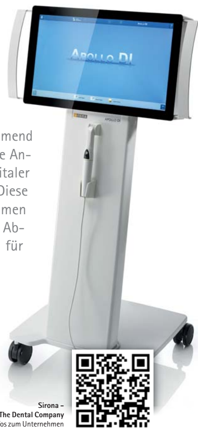
Sirona - The Dental Company Infos zum Unternehmen