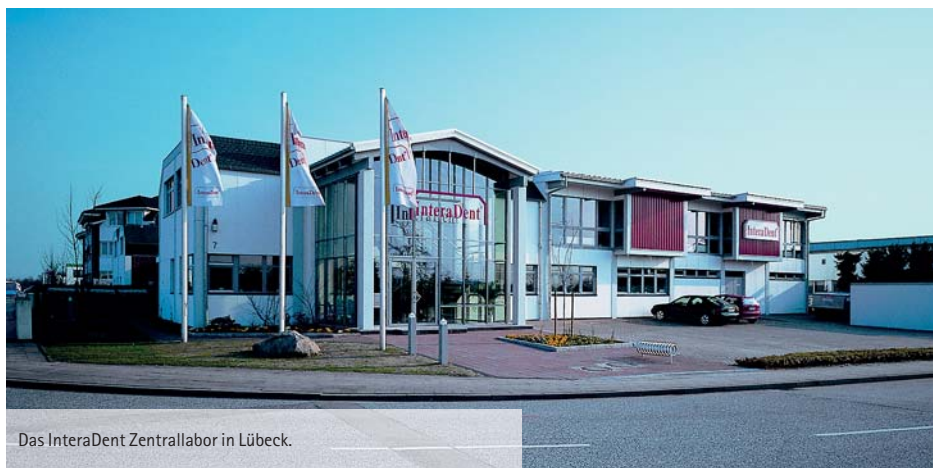
Das InteraDent Zentrallabor in Lübeck.

mung. Diese wird mit wenigen Klicks an InteraDent versendet. Sollte die Aufnahme fehlerhaft sein, erhält der Zahnarzt innerhalb kürzester Zeit einen Rückruf aus dem Lübecker Zentrallabor, sodass bei Bedarf der Abdruck erneut erstellt werden kann. Sind die 3-D-Scandaten im Labor angekommen, wird die Versorgung virtuell am Computer konstruiert und geht anschließend in die Fertigung. Parallel dazu kann aus den digital erfassten Daten ein reales Kunststoffmodell erzeugt werden, um gegebenenfalls manuelle Arbeitsschritte vornehmen und die Passgenauigkeit der Versorgung kontrollieren zu können. An den bekannten InteraDent Lieferzeiten und Materialqualitäten ändert sich nichts – die digitale Abdrucknahme ermöglicht lediglich, dass sich der Zahnarzt auf das Wesentliche seiner Arbeit konzentrieren kann: auf das Wohl