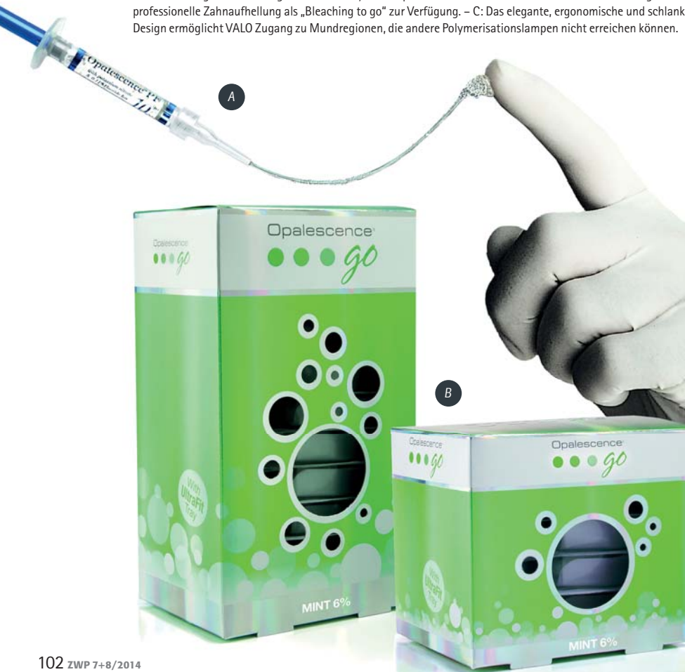
A: Die Viskosität der Opalescence-Gele verhindert ein Herausfließen und hält die Schiene sicher an Ort und Stelle. – B: Mit den gebrauchsfertigen UltraFit Trays von Opalescence Go steht den Patienten eine leistungsstarke, professionelle Zahnaufhellung als „Bleaching to go“ zur Verfügung. – C: Das elegante, ergonomische und schlanke Design ermöglicht VALO Zugang zu Mundregionen, die andere Polymerisationslampen nicht erreichen können.

Marktführer im Bereich der Zahnaufhellung dar. Die Produkte sind so konzipiert, dass sie den Substanzerhalt unterstützen und durch ein hervorragendes ästhetisches Ergebnis Patienten zu einer noch gründlicheren Mundhygiene motivieren. Sowohl im kosmetischen als auch im medizinischen Bereich der Zahnaufhellung kombiniert die Opalescence-Produktreihe eine einfache und patientenindividuelle Anwendung mit qualitativ hochwertigen Inhaltsstoffen. Die patentierte PF-Formel stärkt zusätzlich den Schmelz, verringert Zahnempfindlichkeiten und beugt Karies vor, sodass auch hier der Anspruch an eine ganzheitliche Zahnmedizin voll erfüllt ist: Ultradent Products – mehr als nur Bleaching!