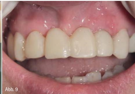
Abb. 2: Klinische Ausgangssituation: mit Komposit reparierte Frontzahnbrücke. – Abb. 3: Präparierte Zahnstümpfe. – Abb. 4: Reparieren des mit Structur 3 gefüllten Alginatabdrucks. – Abb. 5: Noch leicht elastisches Structur 3-Material nach Entfernung der Abformung. – Abb. 6: Natürlicher Glanz nach Abwischen der Inhibitionsschicht. – Abb. 7: Kontrolle der grob ausgearbeiteten provisorischen Brücke. – Abb. 8: Das ansprechende Ergebnis dank Nano-Hybrid-Technologie. – Abb. 9: Eingesetzte Structur 3-Brücke.

Vor der Neuanfertigung wird eine Alginatabformung genommen, die als Negativform für die Structur 3-Versorgung nach der Brückentfernung und der Nachpräparation dient. Früher hat unsere Praxis bei der Herstellung von Provisorien aus weniger belastbarem Material Silikonabformungen für die Herstellung der temporären Kronen und Brücken genommen und zurückgelegt, um bei durchaus aufgetretenen Beschädigungen mit dem gelagerten Silikonabdruck Reparaturen und Neuanfertigungen herzustellen. Dies ist seit der Verwendung von Structur 3 aufgrund unserer guten Erfahrungen mit dem Material nicht länger nötig.