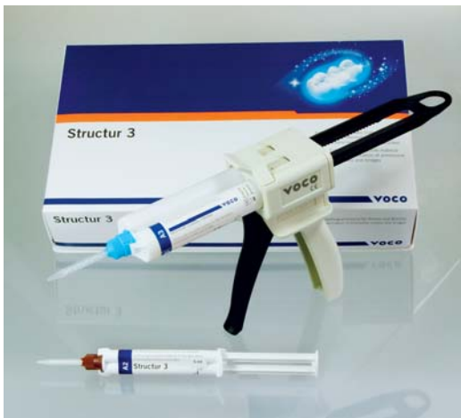
Abb. 1: Structur 3 in der Kartusche und als QuickMix-Spritze.

Durch ein Frontzahntrauma der 57-jährigen Patientin frakturierte die Keramikverblendung der Brücke Regio 13 bis 23 großflächig an mehreren Stellen und wurde zunächst nach dem Unfall direkt mit Komposit versorgt (Abb. 2).