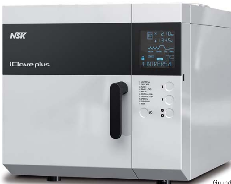
Abb. links: Der iClave plus bietet 18 Liter Kammervolumen, die dank des fortschrittlichen Heizsystems voll ausgeschöpft werden können. Abb. Kreis: Die Kupferkammer ist von in Silikon eingelassenem Heizmaterial ummantelt, das die gesamte Kammer effizient und gleichmäßig erhitzt.

Als einer der führenden Hersteller von Hand- und Winkelstücken sowie Turbinen kann NSK auf langjährige Erfahrung bezüglich deren Aufbereitungsanforderungen, Stärken und Schwächen zurückblicken. Die Markteinführung eines eigenen Sterilisatorenprogramms ist daher ein nahe- liegender Schritt, den das Unternehmen mit der iClave-Serie nun gegangen ist. Sie umfasst zwei Klasse B- und einen Klasse S-Sterilisator.