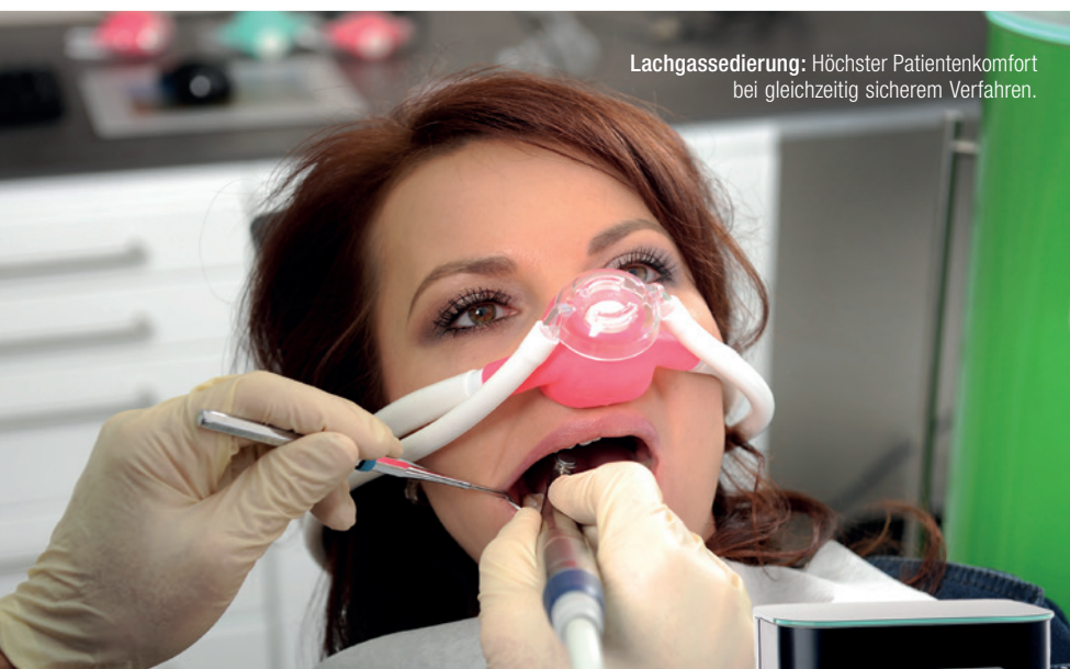
Lachgassedierung: Höchster Patientenkomfort bei gleichzeitig sicherem Verfahren.