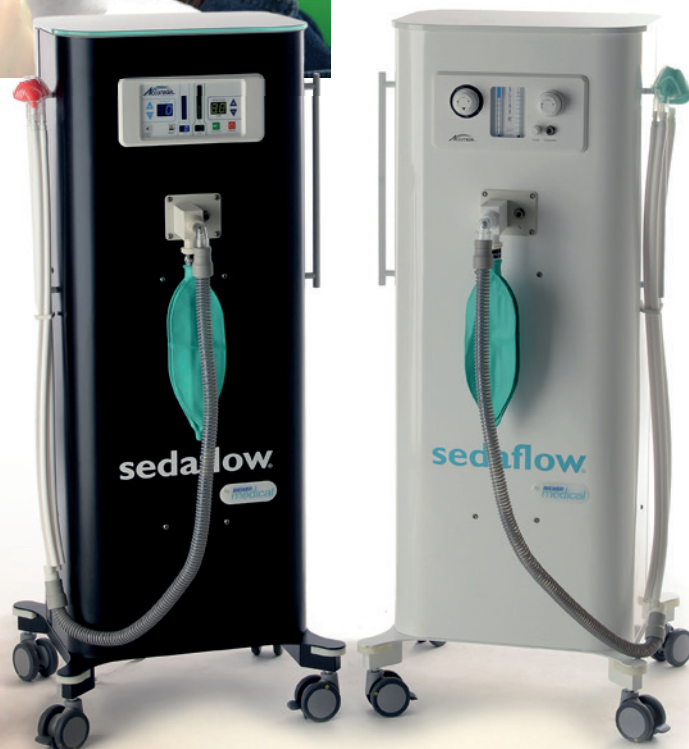
Ultra-schmales Design, seitliche Abrundungen sowie Flügeltüren: das mobile Lachgassystem sedaflow® slimline von BIEWER medical.

Richtig ist: Lachgas gilt als einer der am besten untersuchten Stoffe in der Medizin. Bei Millionen von dokumentierten Anwendungen ist es zu keinem einzigen ernststen Zwischenfall in der Zahnmedizin gekommen; allergische Reaktionen sind in 150 Jahren nicht aufgetreten. Lachgas wird zu über 99 Prozent abgeatmet, es wird im Körper weder abgelagert noch abgebaut. Das Gas hat keine Wirkung auf Herz, Kreislauf, Atmung oder innere Organe und ist somit risikoärmer als eine normale Lokalanästhesie.