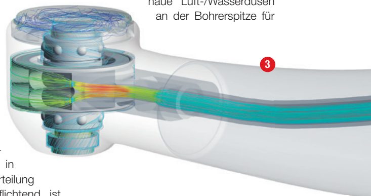
Abb. 1: Eine durchdachte Innovation aus Design und Konstruktion: die Turbine Tornado aus dem Hause Bien-Air. – Abb. 2: Für hohe Anwenderfreundlichkeit ist der Turbinenkopf ergonomisch kompakt und die Geräuschentwicklung mit konstanten 55 Dezibel äußerst gering. – Abb. 3: Außergewöhnlich leistungsstark: Dank der Steady-Torque™-Technologie von Bien-Air erreicht die Tornado eine 30-Watt-Ausgangsleistung.