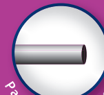
Paste + Flüssigkeit