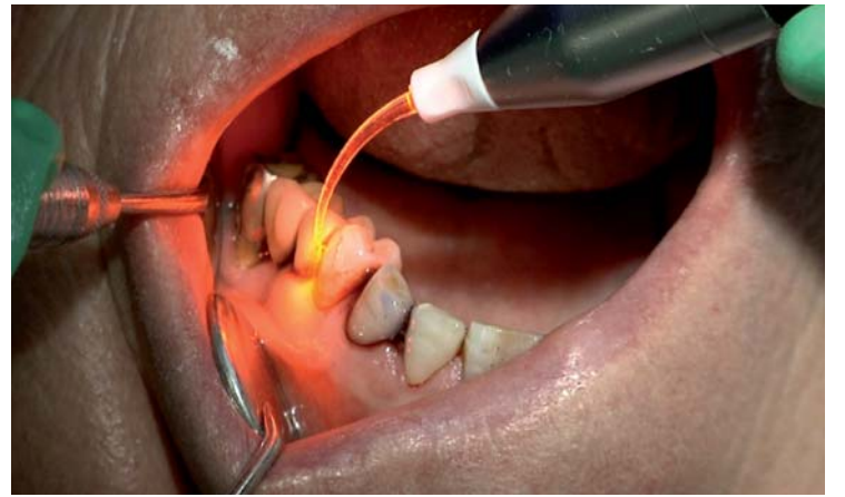
Photodynamische Therapie über 30 Sekunden bei 200 mW und 635 nm Wellenlänge: Einmal pro Wurzelseite ohne Abfahren der Oberfläche.

schmerzfrei und erzielt denselben klinischen Erfolg. Das wurde durch eine unabhängige Studie nachgewiesen, welche an sechzig Patienten/-innen der Universität Greifswald