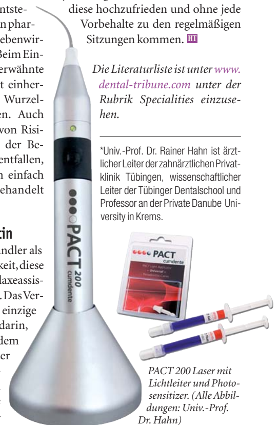
PACT 200 Laser mit Lichtleiter und Photosensitizer.