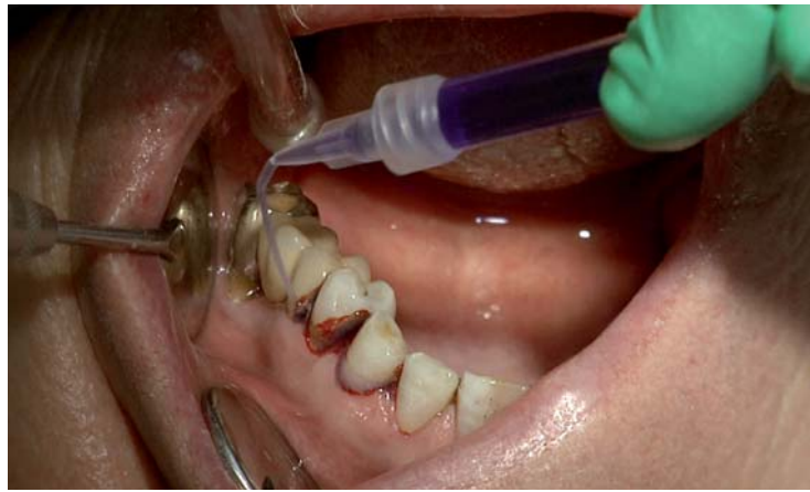
Applikation des Photosensitisers Toluidinblau in alle Zahnfleischtaschen auch bei Blutung: Der Farbstoff kann 10 zu 1 mit Blut verdünnt werden. Es treten keine Verfärbungen auf.

Wichtig für das Festlegen der Recall-Intervalle war bisher eine genaue Beurteilung der individuellen Risikofaktoren, um eine Unter- oder Überversorgung zu vermeiden. Ein Kontrollzeitraum von maximal sechs Monaten hat sich dabei als vorteilhaft erwiesen. Etwa drei Monate nach Scaling und Wurzelglättung kommt es zu einer Wiederbesiedlung der parodontalen Taschen mit Mikroorganismen. 10 Insbesondere bei aggressiven Parodontalerkrankungen sollte dies vermieden und die Kontrollsitzen entsprechend kurz gewählt werden. Die Problematik der möglichen Überversorgung und der fehlenden Patientenakzeptanz führte bisher dazu, dass in der Praxis die Erhaltungstherapie nur bei den wenigsten PA-Patienten/-innen konsequent durchgeführt wird.