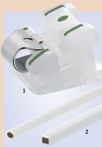
Abb. 1: Farbige Markierungen erleichtern ab sofort das korrekte Platzieren der selbstligierenden QuickKlear®-Brackets. Abb. 2: Dauerhafte Ästhetik jetzt auch in Vierkant – die BioCosmetic®-Bögen von FORESTADENT.

Bernhard Förster GmbH Westliche Karl-Friedrich-Straße 151 75172 Pforzheim, Deutschland Tel.: +49 7231 459-0 info@forestadent.com www.forestadent.com