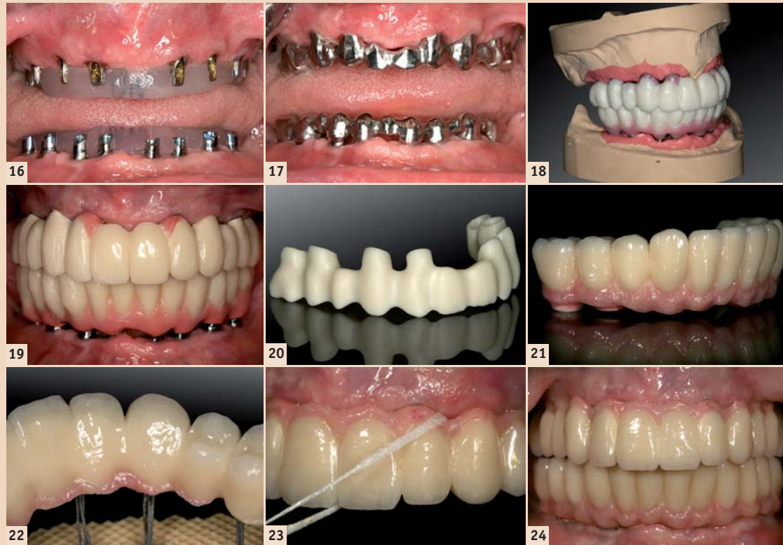
Abb. 16: Implantatabutmenteinprobe für Langzeitprovisorium (Therapeutikum). – Abb. 17: Gerüststeinprobe für Langzeitprovisorium (Therapeutikum). – Abb. 18: Wachsauflage der Ober- und Unterkieferzähne für die Ästhetikeinprobe. – Abb. 19: Kunststoffverblendete Langzeitprovisorien (LZP) auf Metallbasen zur muskulären Kiefergelenkadaptation, vor der Herstellung des definitiven implantatgetragenen Zahnersatzes. – Abb. 20: CAD/CAM-generiertes Zirkon-Brückengerüst aus demselben virtuellen Datensatz wie das LZP. – Abb. 21 und 22: Verblendete, vollkeramische Zirkonbrücken nach Fertigstellung im Labor. – Abb. 23 und 24: Vollkeramische OK- und UK-Brücken zementiert in situ.

Die gewonnenen Bilddaten werden in der Regel im DICOM-Format in die Planungssoftware der entsprechenden Systeme übertragen. Diese Software erlaubt es, Implantate unter Berücksichtigung der prothetisch vorgegebenen Situation und des vorhandenen Knochenangebotes optimal virtuell zu platzieren. Dabei kann auf die Ansicht der Bilddaten in drei orthogonalen Schichten axial, koronal und sagittal sowie in einer dreidimen-