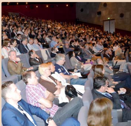
Blick in den vollbesetzten Kongressaal.