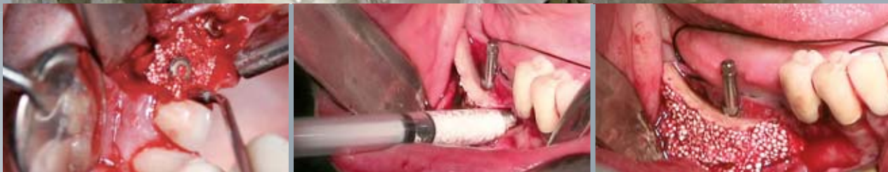
synthetic bone graft solutions - Swiss made