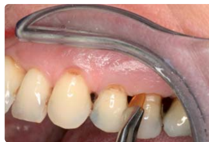
• Chipapplikation beim Patienten.

Für eine Ihrer Studien haben Sie ein neues Behandlungskonzept bei Parodontitis angelegt. Was haben Sie gemacht?