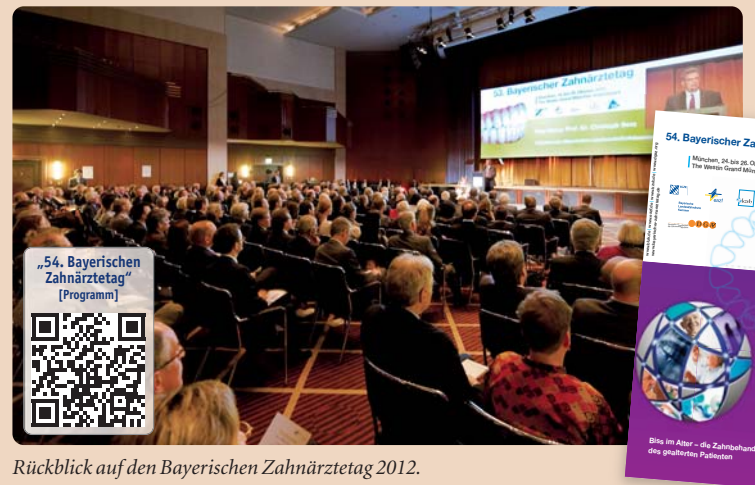
Rückblick auf den Bayerischen Zahnärztetag 2012.