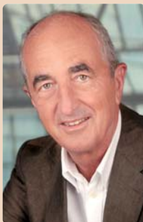
Univ.-Prof. Dr. Gerwin Arnetz

Aufgrund des demografischen Wandels in Österreich rückt die Behandlung älterer Menschen immer mehr in den Mittelpunkt. Diesem Thema wird sich auch während des Österreichischen Zahnärztekongresses gewidmet. Erstmals wird am 4. und 5. Oktober der Jahreskongress des European College of Gerodontology in Graz veranstaltet. Der Präsident des ECG, Univ.-Prof. Dr. Gerwin Arnetz, freut sich über die Kooperation: „Es ist uns eine besondere Ehre, gleichzeitig den internationalen Jahreskongress des European College of Gerodontology (ECG) in Graz abhalten zu können.“