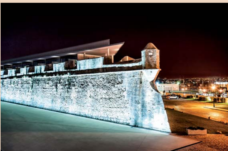
Veranstaltungsort ist das in der historischen Zitadelle von Cascais befindliche und direkt am Yachthafen gelegene Luxushotel Pousada de Cascais.

Mit hochkarätig besetzten Vorträgen startet das FORESTADENT Symposium Anfang Oktober 2013.